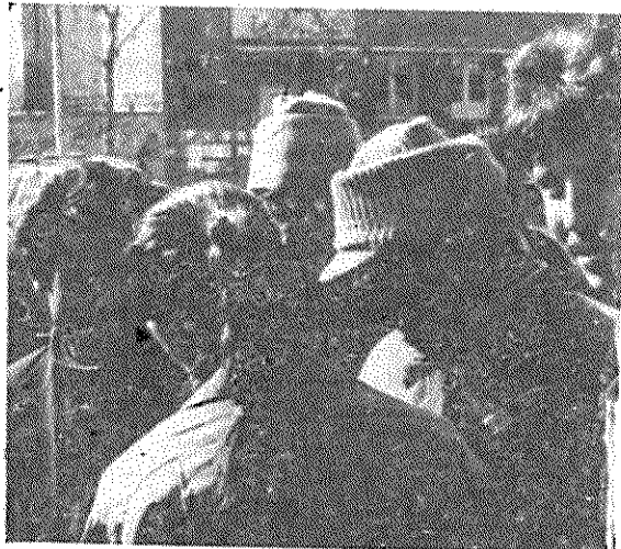
ژحمتکشان: از افزایش هرروزه قیمت ها بیشتر از همه، مارنج میبریم