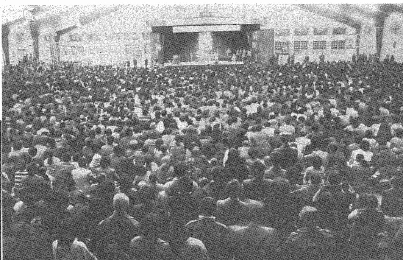
گوشه‌ای از مراسم بزرگداشت نخستین سالگرد انقلاب و چهلمین سالگردت شهادت دکتر ترقی ارانی

نمایشگاه به یاد ارانی از تاریخ ۱۰ تا ۲۰ بهمن همه روزه از ساعت ۷ تا ۳ بعد از ظهر (با استثناء روزهای جمعه) نمایشگاهی بمبادی کسب ارانی، رهبر زحمتکشان ایران، در دانشکده صنعتی شریف، محوطه تالارها، برقرار است. از کلیه علاقمندان دعوت می‌گردد که از این نمایشگاه دیدن کنند. سازمان جوانان و دانشجویان دمکرات ایران