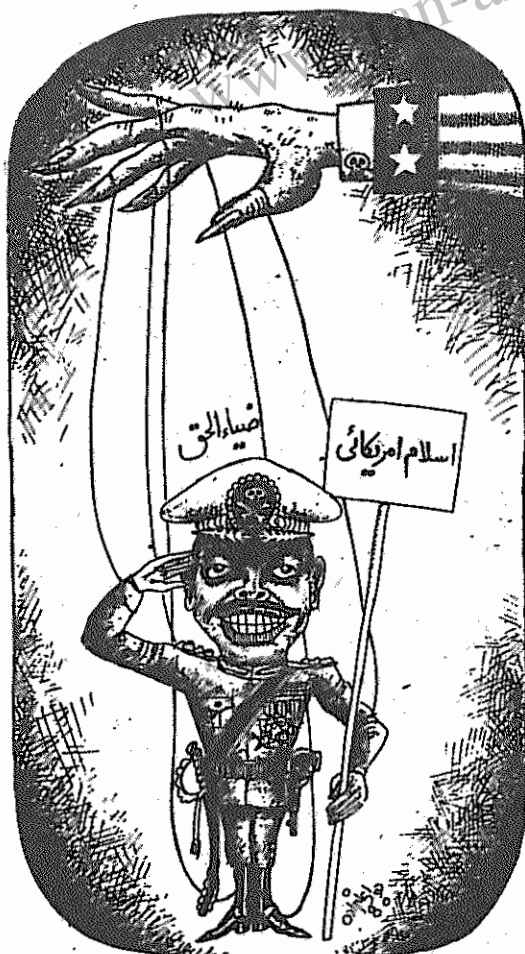
(کعبان، ۱۳ بهمن)