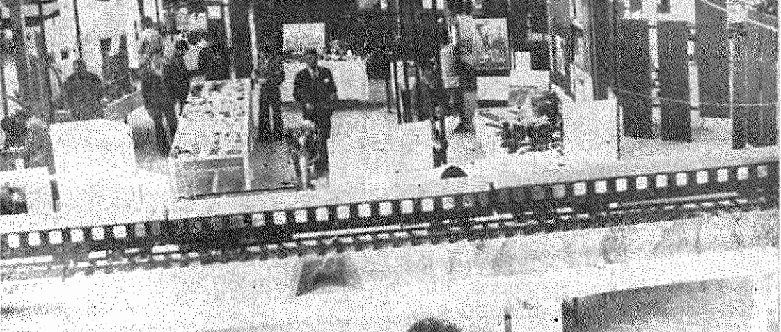
گوشه‌ای از نمایشگاه لوازم یدکی راه‌آهن

در روز اول برپایی نمایشگاه، ۵۰۰ صنعتگر ایرانی آمادگی خود را برای ساختن ۱۰۰۰ قطعه لوازم یدکی اعلام کرده‌اند.