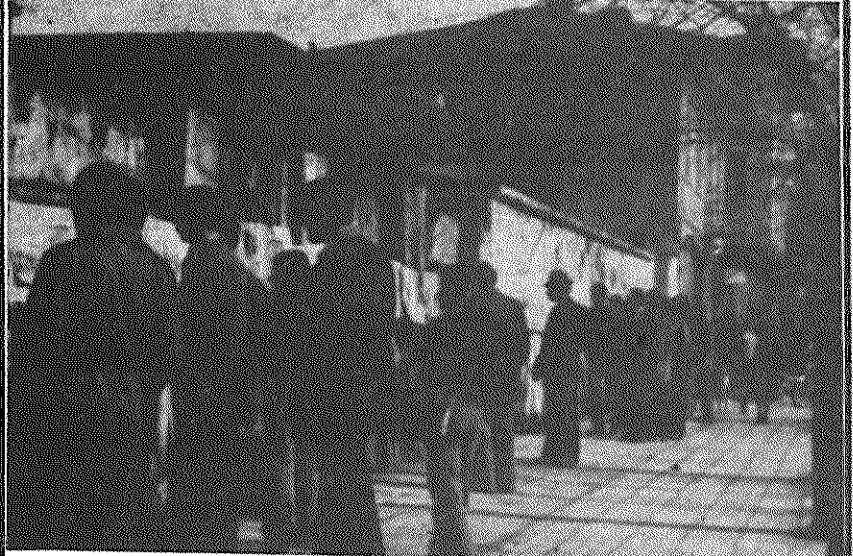
نمایشگاهی از جنایات امپریالیسم آمریکا علیه خلق های جهان توسط جوانان هوادار حزب توده ایران در بندر انزلی برپا شد. این نمایشگاه که به مدت ۳ روز ادامه داشت، با استقبال مردم بندر انزلی مواجه گشت.