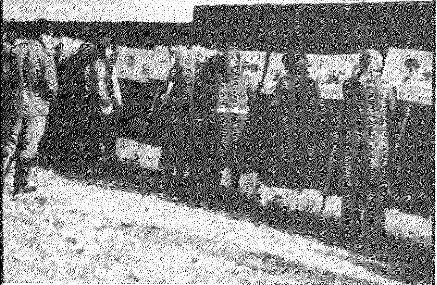
اعضای هواداران حزب توده ایران در آبکنار، نمایشگاه عکس از جنایات امپریالیسم پسر کردگی امپریالیسم آمریکا را بطور بسیار در نقاط مختلف آبکنار برپا کردند، که مورد استقبال پر شور کشاورزان، بازاریان، دانش آموزان فراوان گرفت. در این نمایشگاه جنایات امپریالیسم در ایران، ویتنام، کوبا، شیلی، نیکاراگوئه و... برای روستائیان ناشی گردید.