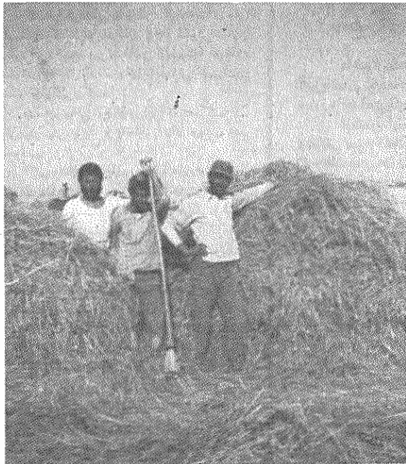
ده قشلاق و درینان - کربال - استان فارس. محصول نمره کار و زحمت دهقانان است و باید مال آنها باشد. زمین مال کسی است که روی آن کار میکند و محصول نیز مال اوست.

اصیل در اختیار خود دهقانان قرار گیرد. این گام اساسی و مهم را باید هر چه زودتر برداشت. انقلاب مادرگداوم ضد امپریالیستی و خلقی خود نمی‌تواند زنجیر اسارت بزرگ مالکی را تحمل کند و لکه بی حتی دهقانان و ستم بر آنان را بردارند داشته باشد. باید بحق به حق‌دار برسد یعنی زمین به دهقانان. نمونه‌های زیر، که اخباری است واصله از استان فارس، یکبار دیگر حدت این مسئله و فوریت حل آنرا نشان می‌دهد: