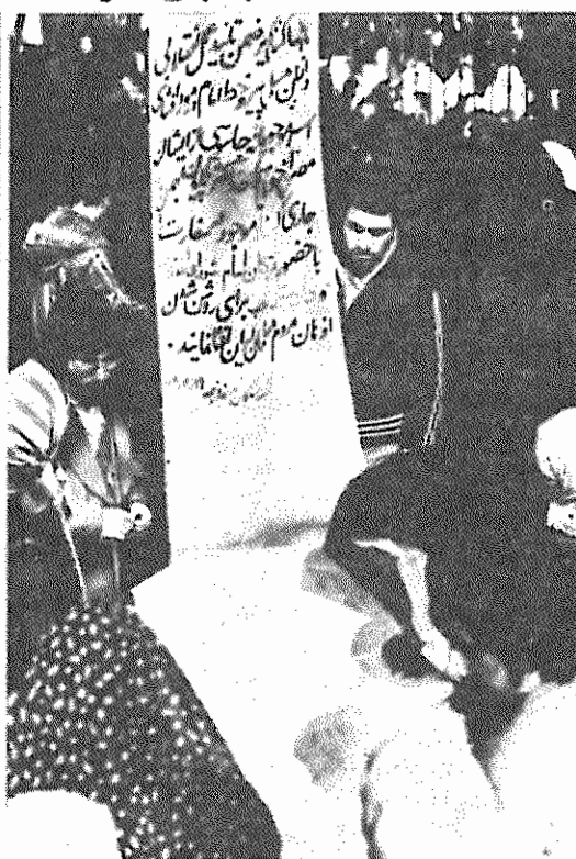
این طوماری است که صدها هزار تن از نمازگزاران دیروز به پشتیبانی از عمل انقلابی دانشجویان مسلمان پیرو خط امام و درخواست افشای اسناد بدست آمده، آنرا امضاء کردند

روز دوشنبه ۲۲ بهمن ماه روز پیروزی انقلاب، منتشر میشود