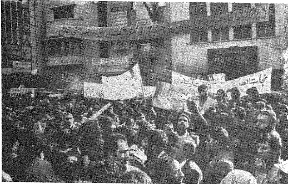
دهها هزار تن از مردم پس از پایان نماز جمعه به مقابل لانه جاسوسی آمریکا رفته و پشتیبانی خود را از دانشجویان مسلمان پیرو خط امام اعلام کردند.

دیروز بعد از ظهر، هزاران نفر از نمازگزاران روزجمعه، پس از اجرای مراسم نماز، برای پشتیبانی از دانشجویان مسلمان پیرو خط امام و آیت‌الله‌خانی، دست به یک راهپیمایی زدند. تظاهرکنندگان که از دانشگاه تهران به طرف لانه جاسوسی در چندین گروه راهپیمایی می‌کردند، شامی دادند، دانشجوی خط امام، افشا کن، افشاکن