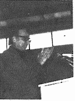
رفیق حمید صفری عضو هیئت سیاسی و دبیر کمیته مرکزی حزب توده ایران مراسم سالروز انقلاب در تبریز را افتتاح میکند

هزاران نفر از زحمتکشان، روشنفکران و طبقات مختلف مردم در این مراسم شرکت داشتند.