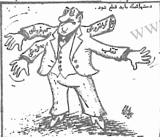
دست‌نویس باید قطع شود. (آرادگان، ۲۵ بهمن ۱۳۵۸)