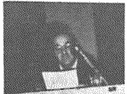
رفیق یاسک امیر خسروی عضو کمیته مرکزی حزب توده ایران در حال سخنرانی

به آرزوهای خود از هیچکوه جراتبازی در راه پیروزی قلمی انقلاب ایران دریغ نخواهیم ورزید. این مراسم پس از اجرای نمایشنامه‌ای که گویای گوشه‌ای از زندگی سرپردهن ابراهیمی در زندان بود، خاتمه پذیرفت.