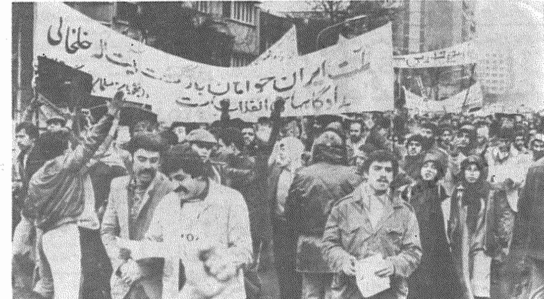
پس از پایان مبارزات، گروه کثیری از نمازگزاران بسوی لانه جاسوسی امپریالیسم آمریکا حرکت کردند تا از عمل انقلابی دانشجویان مسلمان پیرو خط امام، پشتیبانی کنند و ادامه افشاکاریها را تقاضا نمایند. مردم همچنین در حالیکه علیه سازشکاران، جنایتکاران و غارتگران شاعری دادند، خواستار بازگشت قاطعیت انقلابی به دادگاههای انقلاب بودند و از بازگشت آبت الله خلخالی به دادگاههای انقلاب حمایت میکردند.