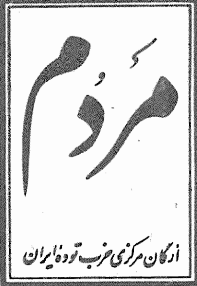
از گان مرکزی حزب توده ایران دوره هفتم، سال اول، شماره ۱۷۱ شنبه ۳۰ بهمن ماه ۱۳۵۸ - تک شماره ۱۵ ریال

امام خمینی، رهبر انقلاب ایران، سلامت خود را بر اساس گزارش پزشکان، کاملاً پایزافته و تا آخر هفته جاری بیمارستان را ترک میکنند. پزشکان اعلام کرده اند: «حال امام فوق العاده خوب است و تمام آزمایشات و نوارها حاکی از سلامت کامل امام است». پایزایی سلامت امام خمینی، برای حزب توده ایران مایه نهایت خرسندی است. در این لحظات حساس که وجود امام مانند همیشه نقش بسیار مهمی در روند انقلاب ایران دارد، رفع بیماری ایشان برای توده ها و حزب توده ایران مژده بزرگی است. ما بار دیگر دوام سلامتی امام خمینی را آرزو می کنیم و اطمینان داریم که توده های میلیونی زیر رهبری ایشان تاریخ کن کردن دشمن اصلی انقلاب ایران، یعنی امپریالیسم آمریکا، به نبرد تاریخ ساز خود ادامه میدهند. حزب توده ایران در این نبرد سترگ همراه خلق و رهبر انقلاب می رزمند و خواهد رزمید.