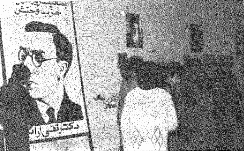
نمایشگاه زندگی دکتر تقی ارانی به مناسبت روز شهیدان حزب و جنبش در رشت برگزار شد. این نمایشگاه که در دبیرستان فروغ رشت، از طرف سازمان جوانان و دانشجویان دمکرات ایران برگزار شد، با استقبال مردم روبه‌رو شد.