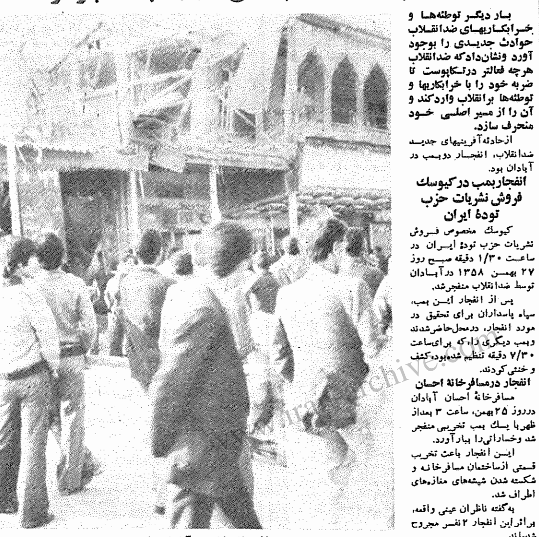
مسافر خانه شاهپور آبادان، که با بمب منفجر شده است

بمب دیگر توطئه‌ها و خرابکاریهای ضدانقلاب حوادث جدیدی را بوجود آورد و نشان داد که ضدانقلاب هر چه فاعلت در دسترس است تا ضربه خود را با خرابکاریها و توطئه‌ها بر انقلاب وارد کند و آن را از مسیر اصلی خود منحرف سازد.