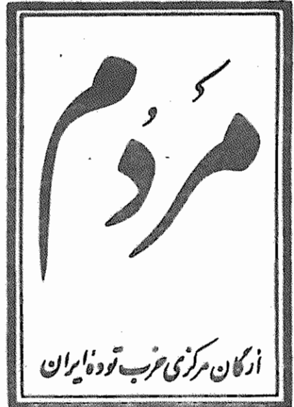
ازگان مرکزی غرب توده ایران

دوره هفتم، سال اول، شماره ۱۷۴ شبه اسفندماه ۱۳۵۸ - شماره ۱۵ دیال