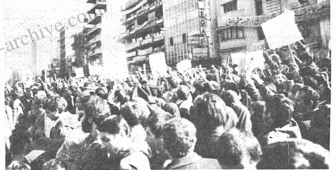
فریاد خشمگین توده ها در برابر جاسوسخانه آمریکا: دانشجوی خط امام! افشاکن! افشاکن!

دیروز در راه پیمایی عظیمی که بعد از نماز جمعه، به پیشانی از دادگاههای انقلاب به طرف لانه جاسوسی انجام گرفت، توده های انبوه مردم خواستار افشای هر چه بیشتر سازشکاران لیبرال از جانب دانشجویان مسلمان پیرو خط امام شدند. در این راه پیمایی مسئله بسج علیه مطرح شد. یکی از این شعارها در این رابطه چنین بود: تورنشات چسبکی همه فرابگیریم علیه امپریالیسم اسلحه دست بگیریم در مقابل لانه جاسوسی توده های خشمگین خلق فریاد می زدند، دانشجوی خط امام، افشاکن، افشاکن! در این اجتماع پیامهای مختلف دانش آموزان فرات شد و دختران دانشمندی مقدساتی نیز سرودی را خواندند. سپس یکی از دانشجویان سخنرانی کرد.