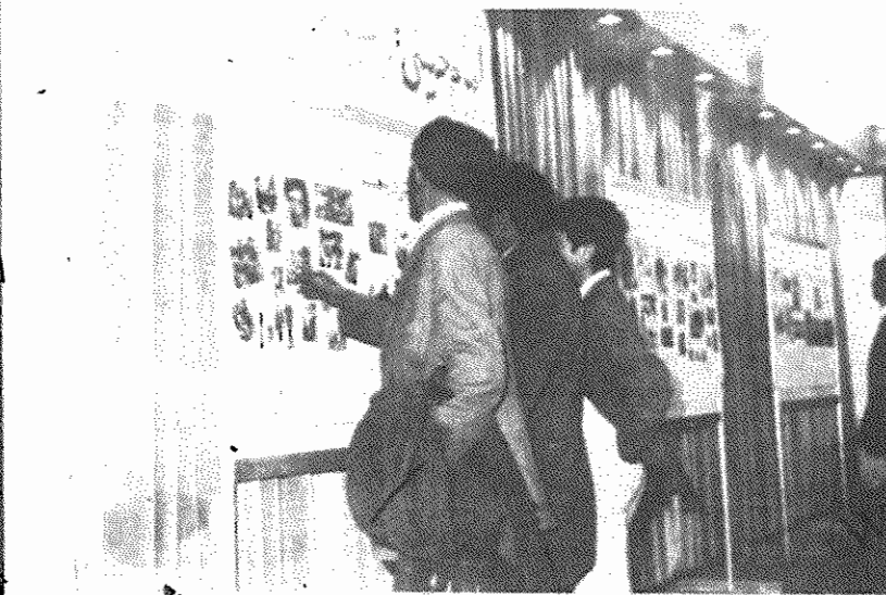
نمایشگاه جنایات آمریکا توسط سازمان حزب توده ایران در کرمان برپا شد. در این نمایشگاه که در موزه صنعتی کرمان بر گزار شد، عکس‌ها و طرح‌های متعددی از جنایات امپریالیسم خونخوار آمریکا به نمایش گذاشته شده بود. این نمایشگاه مورد استقبال وسیع مردم و ویژه سران قرار گرفت.

یکی از بازدیدکنندگان در دفتر یادبود نمایشگاه نوشت: «اولین بار است که از جنایات آمریکا بطور کامل دیدن می‌کنم. امیدوارم نیروهای معنوی خود را هر چه بیشتر با نمایش دادن جنایات آمریکا، این خونخوارکننده، قوی‌تر و متحرک‌تر کنید».