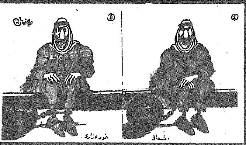
(جمهوری اسلامی، ۴ اسفند)

ما بوقایع اخیر دانشگاه و عدم رسیدگی مسئولین باین حوادث معترضیم و به همین دلیل نیز استعفا خود را اعلام کردیم. موضوعی که برای ما ناراحت کننده ولی در عین حال مبهم مانده این است که چرا مقامات مسئول در مورد این گروهک دوست نفری که بنام اسلام و بنام امام خمینی موجب بهم ریختگی کشور شده اند تا کنون هیچ اقدامی نکرده اند و اصولاً چرا تا این موقع ساکت نشسته اند و اجازه داده اند وضع به اینجا برسد، بعد اعلام کنند که عوامل این وقایع عمال آمریکا هستند و ضداقلابند. و در ذاتی اگر ضداقلابند چرا مانند ضداقلاب با آنها رفتاری شود. وی افزود: ما معتقدیم نه تنها این همه شناخته شده هستند، بلکه عواملی نیز آنها را تقویت میکنند، که همگی بخوبی میدانیم از این کار فقط ضداقلاب بهره میبرد. (کوهان، ۶ اسفند)