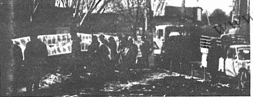
نمایشگاهی از جنایات آمریکا در شبستر برپا شد. این نمایشگاه راهوادران حزب توده ایران در این شهرستان تشکیل داده بودند.