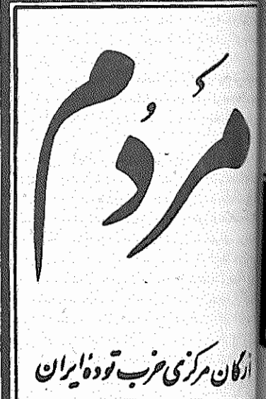
ارگان مرکزی حزب توده ایران

دوره هفتم، سال اول، شماره ۱۸۲ ۱۳۵۸ اسفندماه ۱۳۵۸ - تکر شماره ۱۵ رپال