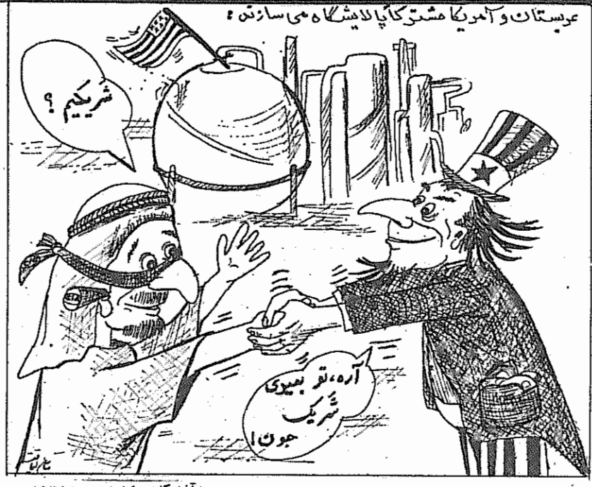
تشتت نیروهای مترقی خطرناکتر از توطئه‌های ارتجاع

کیهان، یکی از اذکارهای شما، افشای جریان بنام جریان لیبرالیسم سازشکار بود که فعلا در مورد آن سکوت کرده‌اید، اساسا نظرتان درباره موفقیت فملی لیبرالیست‌ها چیست؟ در مورد افشای یک جریان لیبرالیستی نقش هدایت و آغازگر این حرکت را ندانیم، از دید بازم امام خمینی در صحبت‌هایشان و در پی‌هایشان بطور کلی جریان‌ها محافظه کارانه و جریان‌ساز را که انقلابی عمل نمی‌کنند، می‌گویند اما حتی زمانی می‌گوید من به تهران می‌آیم و انقلابی عمل می‌کنم و بطور کلی خط امام در تمام موارد کسانی که مورد نظر داشتند، می‌دیدند که خطی است در مقابل خط سازشکاری، خط لیبرالیستی، و وظیفه ما بعنوان عسایر دانشجو که آمدیم و اینجا را گرفتیم و در حقیقت اصلی‌ترین وظیفه‌مان، حفاظت از گروگان‌هاست. نمی‌تواند این باشد که بیاییم و برای مردم خط می‌کشیم، برای مردم خط می‌کشیم، شعار حرکت اینجا را امام مشخص کرده و ما هم، همیشه آنرا تکرار می‌کنیم. اما در کنار این مسأله گروگان‌گیری، مقداری هم اسناد بدست آمده که ما اسناد را افشای کنیم، و به‌وجه تعظیم می‌کنیم و نه این قدرت را داریم که بیاییم جریان را مطرح کنیم و تا به آخر گسترش بدهیم، بخوابیم بپروانیم و آخرس به آن هدفی که باید برسیم، برسائیم. این وظیفه ما نیست، این وظیفه مردم است و وقتی متوجه شدند که چنین اسنادی هست، وقتی متوجه شدند که چنین جریانی، جریان ناخالص است، جریانی است که بوسیله آن آمریکا می‌تواند دوباره بیاید و بر مقدرات ما حاکم شود، آن مردم هستند، آن گروه‌ها هستند، آن نیروها هستند که باید کار کنند جلوان را در برابرند، به‌یچوجه مامسئولیتی در قبال ادامه اینکه دوباره سازشکارها بیایند و دوباره کاری بدست بگیرند یا نکنند یا چه پیش بیاید، نداریم. (کیهان، ۹ اسفند)