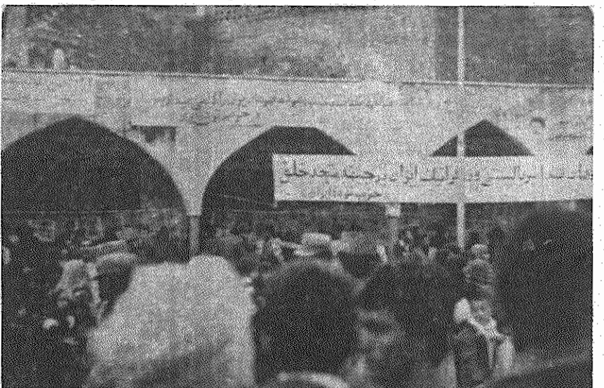
از جانب هواداران حزب توده ایران در دزفول نمایشگاهی از جنایات امریکا و همچنین درباره جبهه متحد خلق و پیروزی انقلاب در میدان اصلی شهر ترتیب یافت. این نمایشگاه با استقبال بی نظیر مردم رزمنده و زحمتکش دزفول روپوشد.