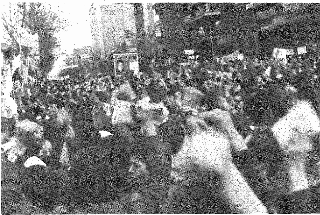
مردم با عزم راسخ از دانشجویان مسلمان پیرو خط امام پشتیبانی میکنند

عصر دیروز يك راه پیمائی در شهر اصفهان به دعوت دانشجویان مسلمان دانشگاه صنعتی اصفهان برای حمایت از دانشجویان مسلمان پیرو خط امام، مستقر در لانه جاسوسی امریکا و محكوم کردن اعمال سازشكاران سرگزار گردید. این راه پیمائی در ساعت ۳:۵۰ بعد از ظهر از چهار راه وفاقی آغاز و بطرف مركز رادیو و تلویزیون اصفهان ادامه یافت. در طول راه پیمائی جوانان دانشجویان با شعارهای: «سازش با امریکا بروتحویل شاه افشا باید گردد» «كوطنه امریکا علیه خلق ایران خنثی باید گردد» از دانشجویان مسلمان پیرو خط امام حمایت کردند و هر كونه سازشكارى با امریکه را محكوم کردند. هم چنین دانشجویان در شعارهای خود خواهان سیاسی قاطع و ضد