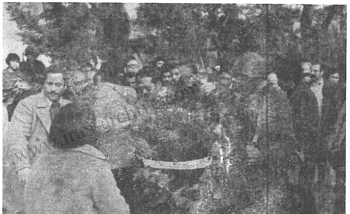
رفیق محمدعلی عمونی، عضو هیئت سیاسی کمیته مرکزی حزب توده ایران و رئیس هیئت نمایندگی حزب توده ایران از جانب کمیته مرکزی حزب توده ایران دسته گلی نثارم از شهیدان خلق فلسطین می کند.