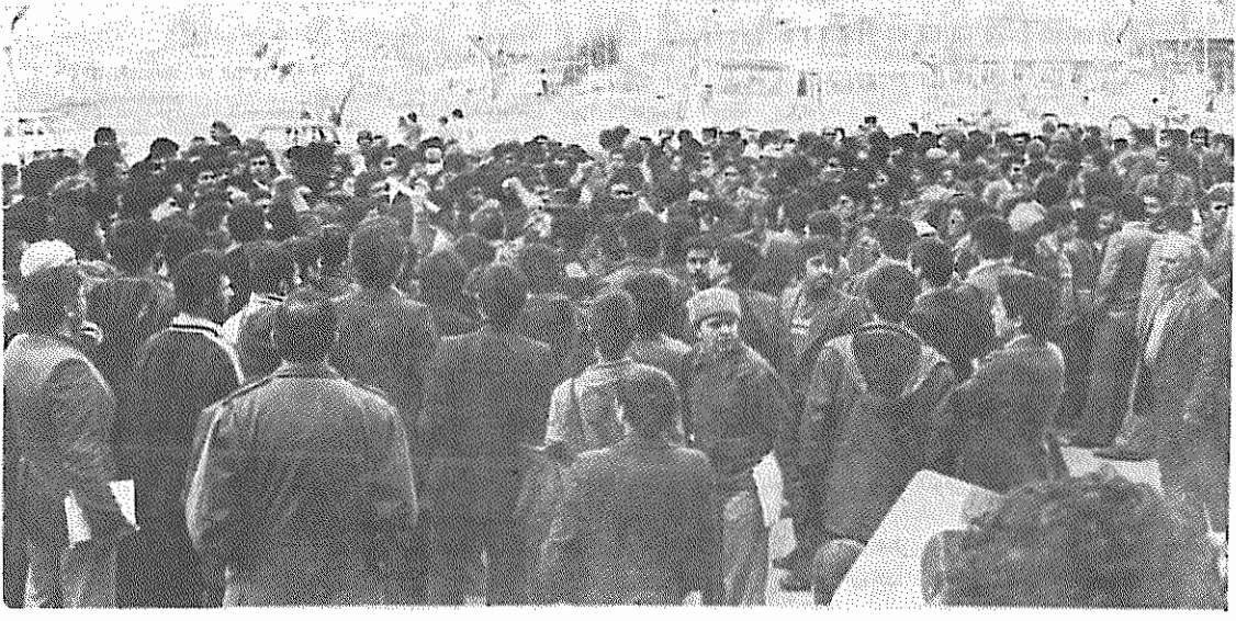
در روز یکشنبه ۱۹ اسفندماه، ساعت ۳ بعد از ظهر، تظاهراتی به پشتیبانی از دانشجویان مسلمان پیرو خط امام، بنا به دعوت جهاد سازندگی خراسان برگزار شد. این تظاهرات در میدان شهدای مشهد برگزار شد، مردم با دادن شعارهای خمینی می‌روزم، سازشکار می‌لرزد. دانشجوی خط امام، مقاومت، مقاومت، از سنگرت محافظت، محافظت. پشتیبانی خود را از دانشجویان مسلمان پیرو خط امام اعلام کردند. ولی پلیت اخلاک‌گرای بعضی از عناصر ضد انقلاب که با دادن شعارهای انحرافی سعی در برهم زدن تظاهرات را داشتند، برای جلوگیری از تشنج و درگیری، ادامه تظاهرات از طرف مردم، لغو کردند.