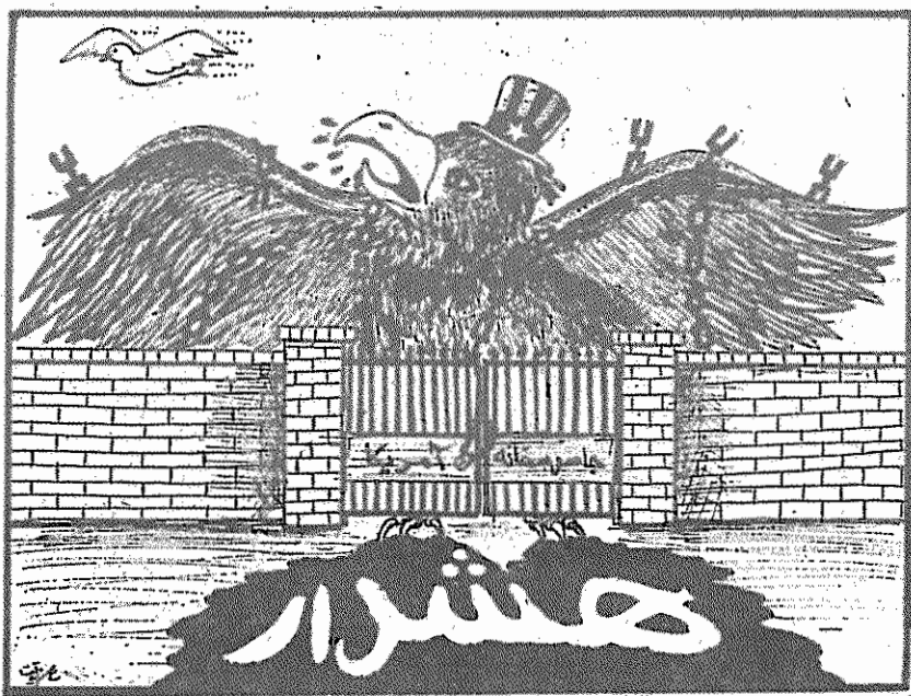
(آزادگان، ۲۱ اسفند ۱۳۵۸)

تهران - خبرگزاری پارس - کارگران شوراهای اسلامی کارگران در اطلاعیه ای اقدام دانشجویان مسلمان پیرو خط امام جنی بر عدم پذیرش درخواست ملاقات با گروگانها را تأیید کرد و اعلام داشت که اس گروگانها پس از تحویل شاه مخلوع بسته به رای ملت و نمایندگان آنها است و کار کمیسیون تحقیق فقط بررسی و تحقیق جنایات بشمار شاه مخلوع است. در این اطلاعیه آمده است: «ما هر گونه عمل سازشکارانه را در مورد گروگانها محکوم می کنیم و تا استرداد شاه مخلوع قطع تمام وابستگی های سیاسی - نظامی - اقتصادی و فرهنگی خود از آمریکا به مبارزات خود علیه این جبهه نخبه اوری رجماد ما خواهیم داد.» (جمهوری اسلامی، ۲۰ اسفند)