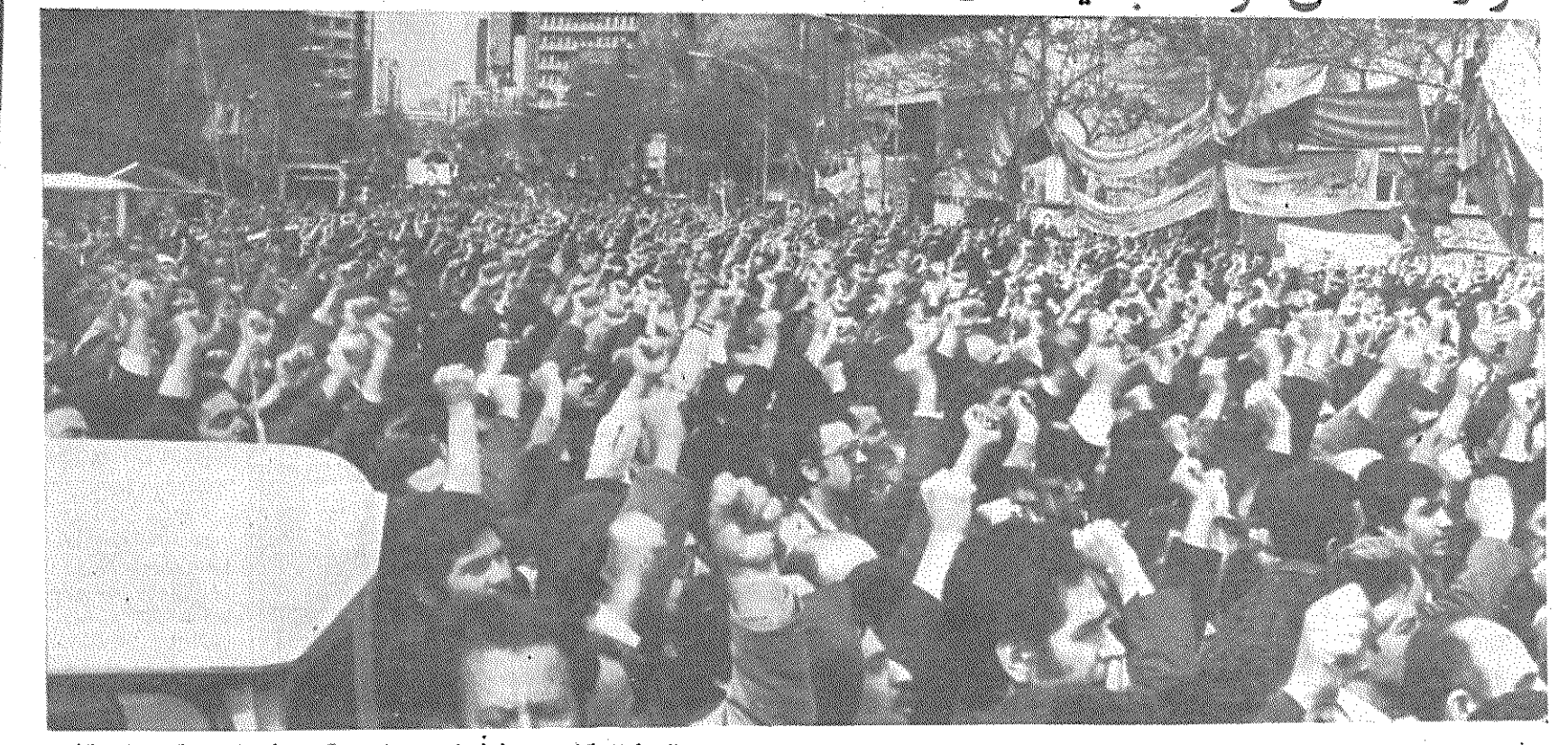
تظاهر کنندگان دیروز فریاد میزدند: مرگ بر شیطان بزرگ - آمریکا

زنان و مردان، کودکان و پیران، خلق انبوه تر میشد، فریادهای سراسر میبکشت. جوش و خروش مردم با آتش دهن بر جم امریکای بیشتری گرفت. مردم یکصد فریاد میزدند: مرگ بر سادات، مرگ بر شاه کارتر، کارتر، حامی شاه مرگ بر شیطان بزرگ، آمریکا - ملت ما بیدار است، از امریکاییان است، انتقال شاه خائن، یک حیل جدید است. گره کرده شمار می دادند: ماهمه اهل جنگیم نه زیر بار ننگیم - تا آخر عمر مان با آمریکا می جنگیم - آمریکا، آمریکا! ارتش بیست میلیونی، دشمن سرسخت توست شمارها لحظه ای قطع نمیشد. خشم و خروش مردم با یانی نداشت. هر لحظه بر جمعیت افزوده میشد، مردم از سراسر شهر می رسیدند، عکسهایی از امام خمینی در دست داشتند، شمار می دادند، شاه جنایت پیشه، اینجا مجازات میشه - فرار شاه خائن، توطئه جدید است - شاه، بگین وسادات نوکران امریکا نزدیک شهر میل راه میمایان از نقاط مختلف تهران به لانه جاسوسی رسید، سدها از نفرز مردم زحمتکش تهران با مشتهای سدها از نفرز از مردم تهران برای محکوم کردن توطئه جدید امپریالیسم امریکا و رژیم دست نشانده آن، مصر، به خاطر بنام دادن شاه مخلوع، دیروز در تهران دست به راهپیمائی و تظاهرات وسیعی زدند. از ساعت ۹ صبح دیروز، مردم از نقاط مختلف تهران حرکت کردند و به طرف لانه جاسوسی امریکا به راهپیمائی پرداختند. تظاهر کنندگان، در حالیکه