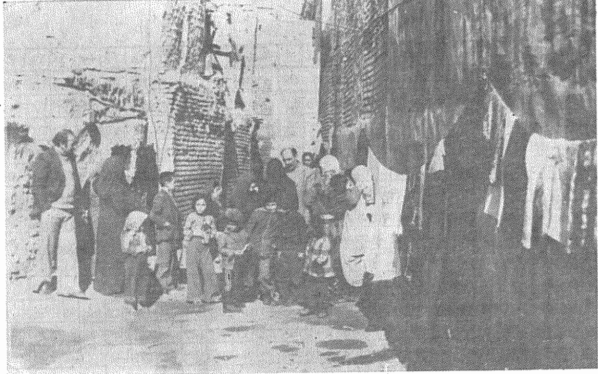
بیکاری، آلونک‌هایی که هر آن ممکن است فرو بریزد، نداشتن آب، برق، پزشک، حمام... سهم مردم این محله از «تمدن بزرگ» است

«در این محله، که ۱۳۳ خانوار زندگی می‌کنند، درد عمده نداشتن مسکن و جای مناسب برای زندگی است. من خودم درگیرودار انقلاب بیکار شدم و الان با فروختن سیگار خرج زندگی زن و بچه‌ام را می‌گذرانم. شبها شده که پادست خالی پیش زن و بچه‌ام برگشتم و آن موقعی است که از روی خجالت نمیتوانم به صورت آنها نگاه کنم.»