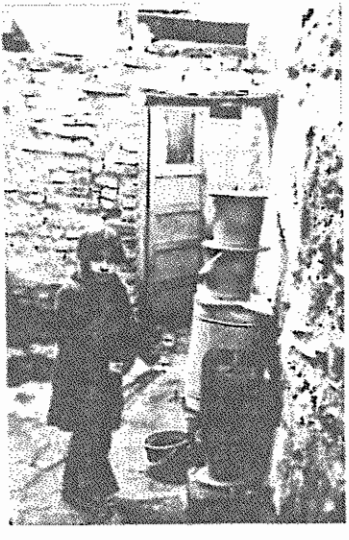
این منبع آب زنگ زده در مرکز تهیه آب آشامیدنی! برای بچه‌های محله است

ما قیلا در اینجا زندگی میکردیم، ولی وقتی که برادر ریش چاه، کف زمین فرو رفت، مجبور شدیم که به اتاق دیگری، یا بهتری، برویم. به فسی دیگری نقل مکان کنیم و آن برای همان قفس ماهی ۵۰۰ تومان اجاره میدهند. فکشرش را بکنند، من با زن و بچه‌ام، باروزی ۹۰ تومان حقوق، چطور می‌توانیم از این زندگی با این هزینه کم‌ترش کنیم؟ باور میکنید که بچه‌هایم هفته‌هاست که لب به گوشت نزده‌اند! یکی هم پیداشد و پدر دل ما برسد. هرچی باشد ما هم حق زندگی کردن داریم. این زندگی نیست که ما میکنیم، بلکه يك نوع مرگ تدریجی است.