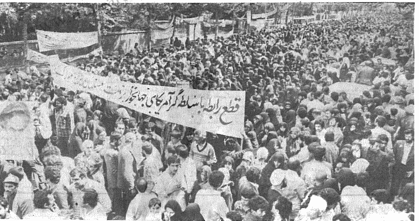
قطع رابطه با سلطه گر، آمریکای جهانخوار بر ملت مسلمان ایران مبارک باد!

سپل عظیم و خروشان خلق در سطهای گره‌خورده اتحاد به طرف میمادگاه، جاری است. می‌آیند و می‌آیند تا خرسند از شکست نیمه‌راهان و عذرو رزان، خرسند از پایداری و پیشرفت انقلاب کرده‌اند، به رهبری که دشمن و همدستان وی را از بازگرداندن دوران پیشین مایوس نموده و شوش و دیوانه‌نموده و فرستاده‌های یک نیرده می‌کین، سرنوشت‌ساز و نهائی‌ها دارند. ترین و خون‌نخوارت بن امپریالیستها، امپریالیسم آمریکا، پیمان اتحاد ورزم ببندند. با چهره‌های به شیارشته رنج، کارگر، دهقان، دانشجو و دانش‌آموز، همه و همه با عزم رزم و کسب آزادی و استقلال از راه می‌روند. دیروز میلیونها نفر از گروههای مختلف مردم در راه پیمائی عظیم وحدت از نه نقطه تهران حرکت کردند. در این راه پیمائی که در پی قطع رابطه با امپریالیسم آمریکا انجام شد، پلاکاردهایی علیه شیطان بزرگ، امپریالیسم آمریکا حمل می‌شد که هم آنها چنین بود: ما از تهدیدات نظامی آمریکا نمی‌هراسیم. قطع رابطه با امپریالیسم جهانخوار را به هموطنان تبریک می‌گوئیم. قطع رابطه با شیطان بزرگ، آمریکای جهانخوار بر ملت مبارز و آگاه ایران مبارک باد.