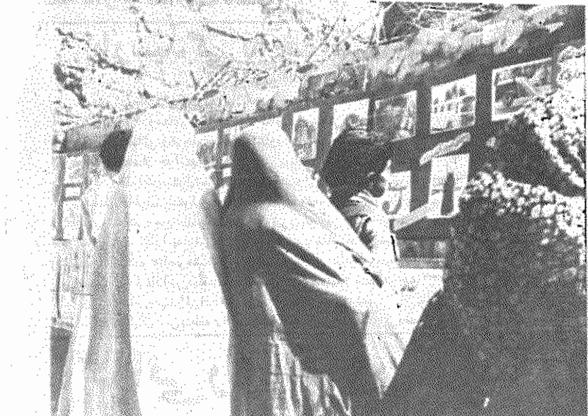
از طرف حزب توده ایران، سازمان شهرستان سمنان، نمایشگاه ضد امپریالیستی بمدت ۶ روز از تاریخ ۱۳۵۹/۱/۱۵ برقرار بود که با استقبال خوب مردم رو برو گردید.

۴- تسهیل در ارتباط دو جانبه روستا و شهر و برعکس، ۵- ارتباط روستاها با مراکز سیاسی، اجتماعی، فرهنگی و آموزشی در شهرها و از این سو کمک به رشد فرهنگی و زندگی معنوی درده و برخورداری از مواهب تمدن در روستاها، ۶- جذب بخش عظیمی از نیروهای کار غیر فعال برای ساختمان و توسعه جاده‌ها و کمک به حل مسئله بیکاری آشکار و پنهان.