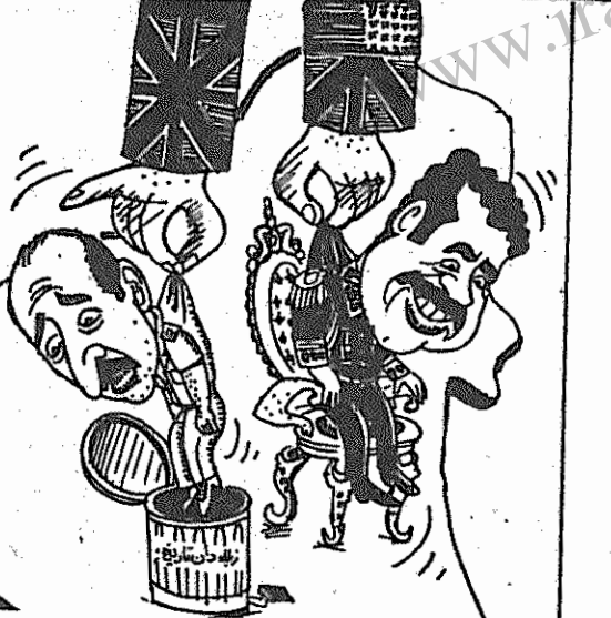
صدام حسین، حلقه های از سلالة مزدوران آمریکا (انقلاب اسلامی، ۲۰ فروردین)

بموجب یک آگهی تجاری، که در روزنامه رسمی کشور مورخ ۵۸/۱۲/۹، با عنوان «آگهی تغییرات شرکت اتاق کو ایران» ایران شوند.