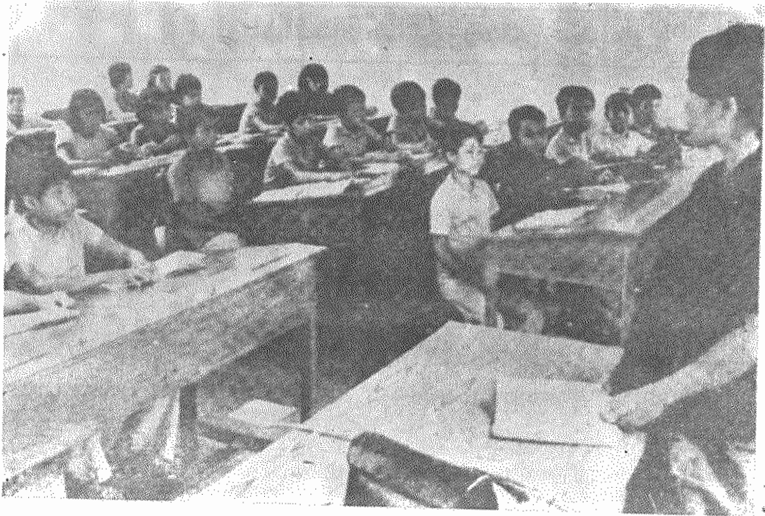
پس از آزادی خلق از اسارت رژیم مائوئیستی پول پوت - ینگساری، کودکان می توانند دوباره به مدرسه بروند. پدران و مادران این کودکان بدست رژیم پول پوت کشته شده اند.

خلق رزمند و ستم دیده کامیو جیا نخستین سالگرد پیروزی خود را بر رژیم خودکامه و خونخوار پول پوت - ینگساری جشن میگیرد.