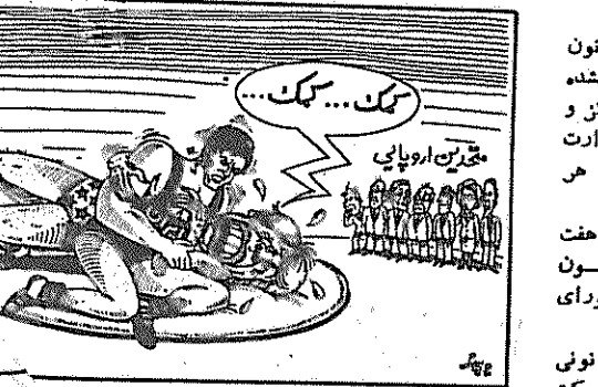
(کها، ۲۷ فروردین)