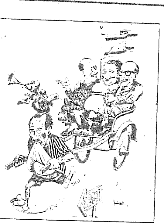
(امت، ۲۷ فروردین، ۱۳۵۹)

کشور عزیز و انقلابی مادر شرایط خاصی قرار داد. امپریالیسم جنایتکار آمریکا برای به شکست کشاندن انقلاب بزرگ ضد امپریالیستی، دمکراتیک و خلقی ایران، توطئه‌های خود را تشدید کرده است. امپریالیسم جنایت‌پیشه آمریکا در این راه از همه امکانات خود استفاده میکند. از زرادخانه نظامی، سیاسی و تبلیغاتی خویش، از قطع مناسبات سیاسی و محاصره اقتصادی گرفته تا ارسال ناوگان دریایی به اقیانوس هند و خلیج فارس، از تحریک رژیم بعثی عراق و تجاوز به سرحدات ایران گرفته تا توطئه و دامن زدن به جنگ برادر کشی و انفجار لوله‌های نفتی و ایجاد تشنج در گوشه و کنار کشور.