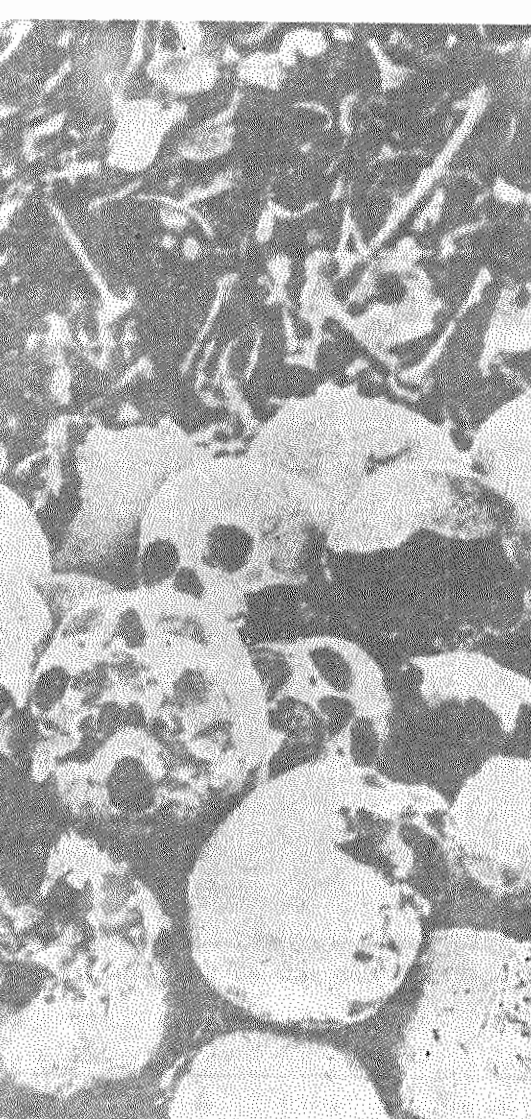
گورهای جمعی - از شایع فجایع وحشتناک رژیم مائوئیستی پول پوت - ینگساری

ولی برنامه مابین تریزد باز این فراز نهاد و ایجاد یک نظام دیکتاتیک خلق را قرار داد. خویش گدار تا خلق کامیو جیا در راه ساختمان کشوری براساس «سوسیالیسم مستقل» دیکتاتیک، با طرف و غیر متعهد بشوی سوسیالیسم گام بردارد. «جبهه متحد» در عرصه سیاست داخلی، توسعه اقتصاد ملی، احیای نظام پول و روابط تجاری و محو کامل تبعیضات رژیم سرنگون شده مائوئیستی در زمینه ایجاد سوسیالیسم را هدف خود ساخت. «جبهه متحد» در زمینه سرزمین و وظایف عملی، با بیان بخشیدن به تمییز بین شهرنشینان را - که از جانب دارو دسته سرسپرده یکن اعمال میشد - در دستور روز نهاد، قاعده شهر و رندان کامیو جیا در عرصه های سیاسی، اقتصادی و اجتماعی از حیوان و تکلف برامری سرمنده شوند. همه کسانی که به «جبهه متحد» حاشان جو -