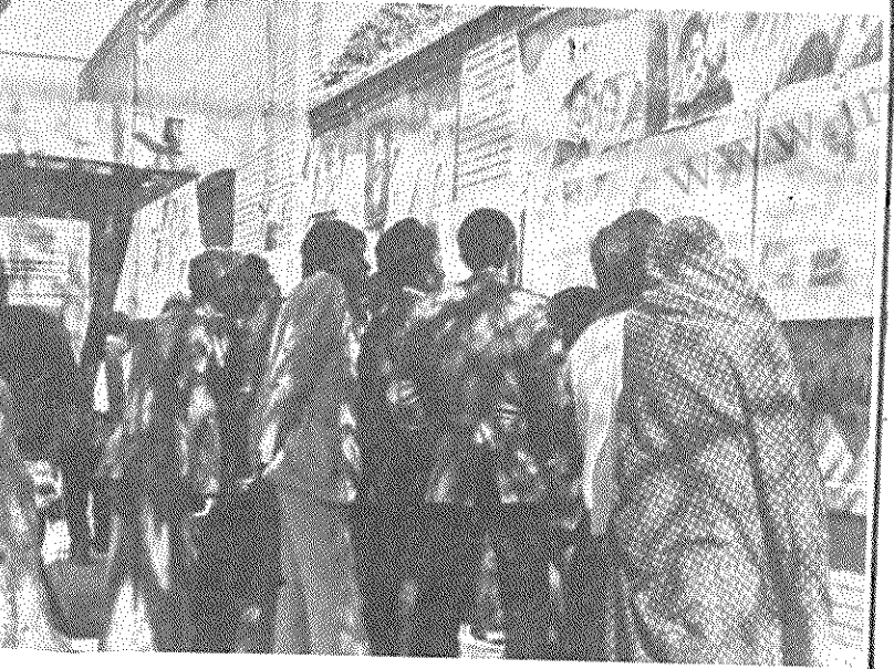
در سالگرد جمهوری اسلامی ایران، از طرف سازمان جوانان و دانشجویان دمکرات ایران در نیشابور، نمایشگاهی در مورد سیر انقلاب ایران ترتیب یافت. این نمایشگاه که بمدت سه روز ادامه داشت، با استقبال وسیع مردم رو بر رو گردید.