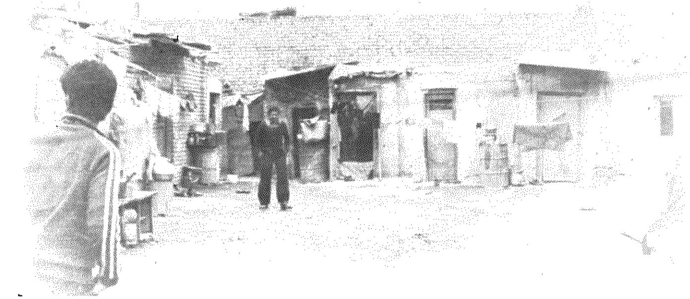
زحمتکشان ساکن شهرک ۱۷ شهریور در تنها گاراژ محله چندین آلونک ساخته اند.

● برای ۴۰ هزار نفر جمعیت شهرک هفده شهریور فقط یک درمانگاه وجود دارد، که آنهم بیشتر مواقع بسته است