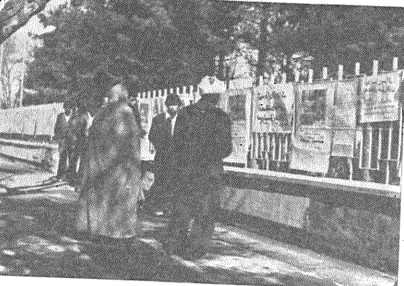
از طرف هواداران حزب توده ایران در نیشابور نمایشگاهی از جنایات امپریالیسم آمریکا در این شهر ترتیب یافت. این نمایشگاه که چند روز ادامه داشت، مورد استقبال زحمتمندان این شهر قرار گرفت.