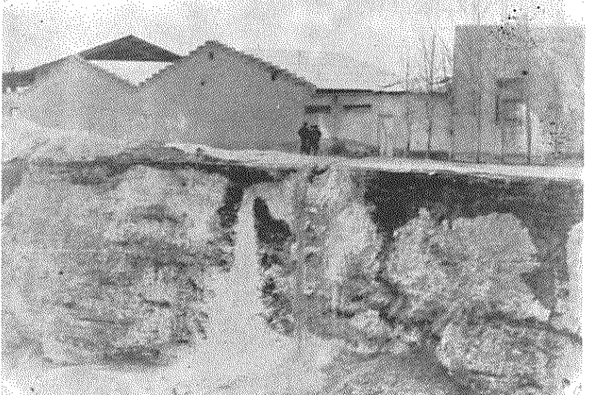
سودجویان برای بدست آوردن ماسه گودال های عمیق در شهرک ۱۷ شهریور حفر کرده‌اند.

از کمیته بیرون می‌آئیم. با دیگر سیمای شهرک را می‌نگریم. هر نقطه‌اش بسازگویی دردناک است. اهالی شهرک هفده شهریور منتظرند که ثمرات انقلاب در این محل هم ببینند و آثار شوم رژیم گذشته زدوده شود.