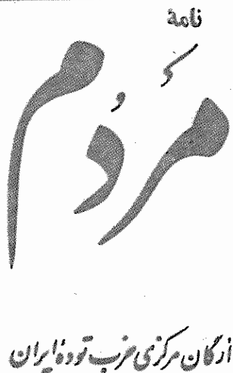
ارگان مرکزی حزب توده ایران

کمیته صنفی امام اعلام کرده است که در آینده، روز-های جمعه، گرانی و شاق در ملاء عام شلاق خواهند خورد. به تکرار گفته ایم و باز هم میگوئیم که راه جلوگیری از گرانی و گرانی فروشی نه شلاق است و نه خواهش و تمنا و بند و اندرز. اگر مقامات مسئول مملکتی هر روز در برابر میکروفن خطابها در دم گرانی فروشی ایراد کنند، اگر بازاریان روزی صد بار آمادگی خود را برای ایزان کردن باری اجناس در بوق و کرنا بدهند و اگر بوس هر گداز و مهربان تخته شلاق گسترده شود، تا زمانیکه از نظر مسئولان مملکتی، ریش- های گرانی و گرانی فروشی شناخته نباشد و برای از میان برداشتن آن وارد عمل جدی نشوند، تا زمانی که برنامه های معقول اقتصادی تنظیم نشود و تصمیمات صحیح اتخاذ نگردد، محال است بتوان گرانی و گرانی فروشی را ریشه کن ساخت. بنابراین هرگونه برخورد سطحی مسئولان با این مسئله مهم، نه تنها آمیدی در دل مردم بر نخواهد داشت، بلکه آنان را نومیدتر خواهد ساخت. میان عرصه و تقاضای بسیاری از کالاهای مورد نیاز مردم، آشکی وجود ندارد و تقاضا بر عرصه میچربد و این خود ایزان گرانی بقیه در صحنه ۲