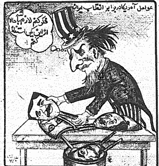
(آزادگان، ۲۸ فروردین ۱۳۵۹)

این افراد با شعار در راه ما راه علی است، مرکز به کونست و با حمله بر آن سزایان علنا بر ضد اسلام و بر ضد خط امام - خمینی حرکت میکنند. مگر نه اینکه، بنی صدر شهر یانی را مأمور حفظ نظم شهرها نموده و برای جلوگیری از این نوع اعمال آنها را به مسولیت شرمی خویش آگاه کرده‌اند، پس