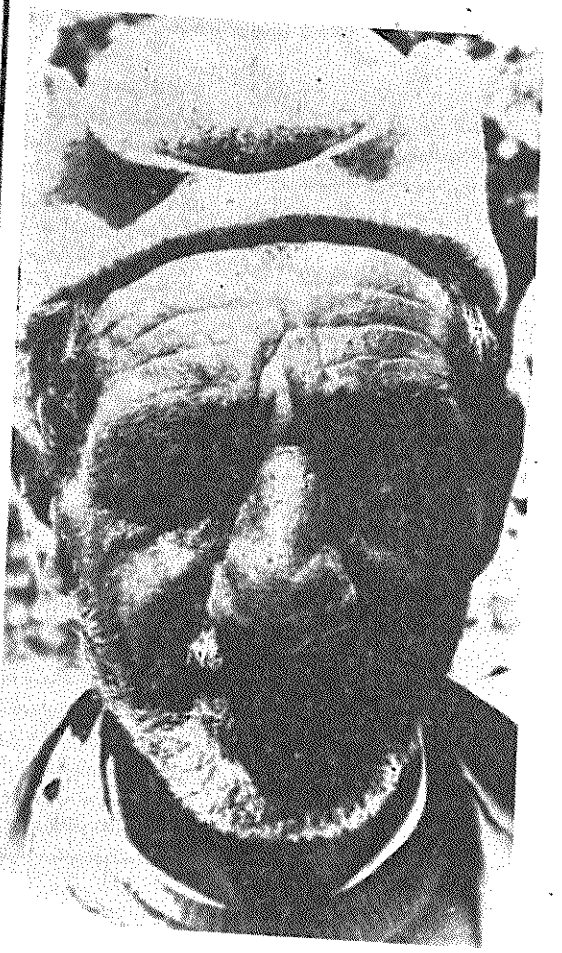
دهقان ایرانی یکدنیا رنج و غم پشت سر نهاده ولی به آینده آزاد وزندگی بهتر چشم میدارد