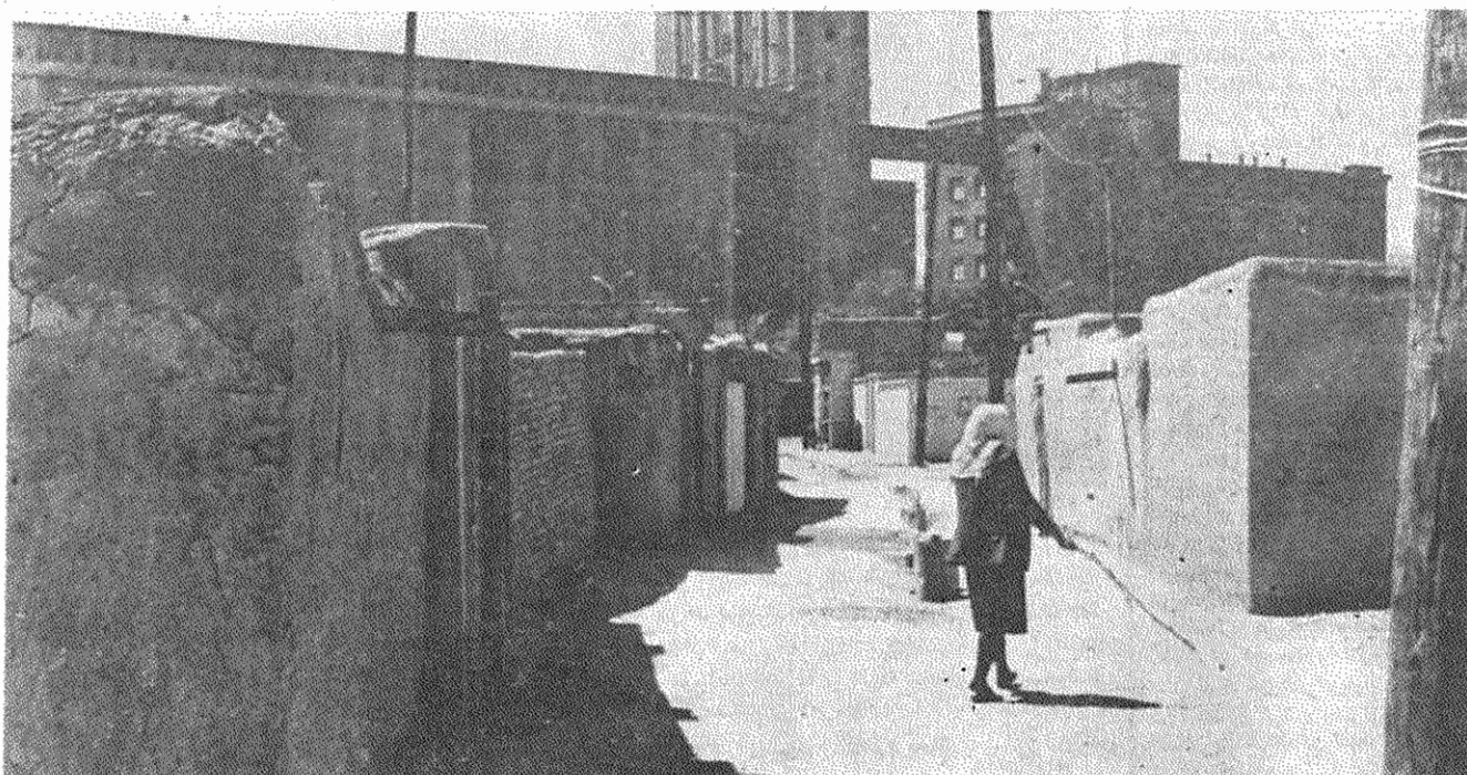
ترك آباد پشت سیلواست، با سرورونی بهتر از محللات فقر دیگر، اما با همان مشکلات و کمبودها

در میان محله محوطه وسیعی قرار دارد که دولت طاغوت سالها تصمیم داشته در آنجا فضای سبز ایجاد کند، اما کاری انجام نداده است. خانه‌های خشتی و گلی، از سالیان