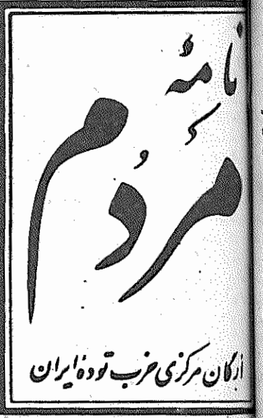
از گان مرکزی حزب توده ایران دوره هفتم، سال دوم، شماره ۲۲۲ شماره ۲۲ اردیبهشت ۱۳۵۹ - تک شماره ۱۵ ریال

برقراری روابط می کنند. این روابط صد البته روابط نوینی بر پایه حقوق برابر است، آنها خواب «روابط خوب گذشته» را می بینند. برژینسکی، این نماینده هار ترین انحصارات اسلحه سازی امریکا، در حالیکه سیا و پنتاگون در صحرای آریزونا تدارک حمل تازمای را بایران می بینند، می گوید: «با آزاد شدن گروگانها (بخوان جاسوسها) امیدوارم روابط خوب گذشته با ایران از سر گرفته شود. امریکا از دیر رذیلاته مردم ما را دعوت به