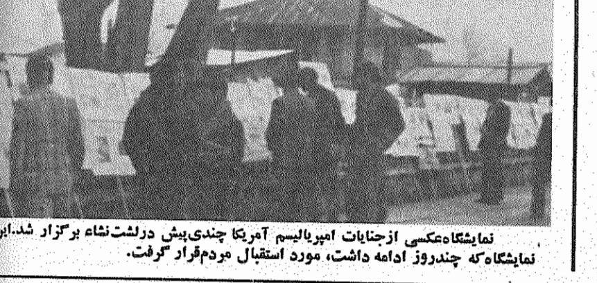
نمایشگاه عکسی از جنایات امپریالیسم آمریکا چندی پیش در لشت نشاء برگزار شد. این نمایشگاه که چند روز ادامه داشت، مورد استقبال مردم قرار گرفت.

امپریالیسم با نیروهای مسلح و تجاوز نظامی توانست انقلاب استقلال طلبانه مصر را درهم شکنند. امپریالیسم این انقلاب را توانست با جدا کردن آن از دوستان واقعی استقلال مصر، بویژه از اتحاد شوروی، بوسیله «ضد انقلاب خرنده» منهدم کند.