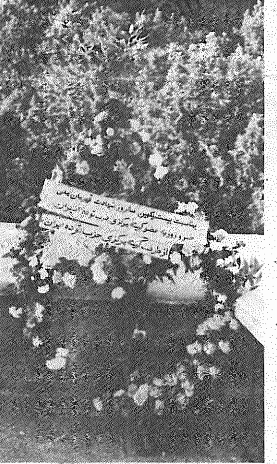
دیروز، ۲۱ اردیبهشت ماه ۱۳۵۹، بمناسبت سی و یکمین سال شهادت خسرو روزبه، عضو کمیته مرکزی حزب توده ایران وقهرمان ملی ایران، از جانب کمیته مرکزی حزب توده ایران دسته گل نثار شهید بزرگ خسرو روزبه شد.