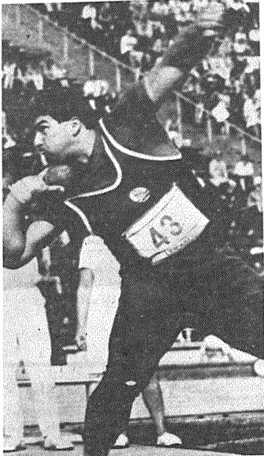
ورزش جمهوری دموکراتیک آلمان شهرت جهانی دارد: اودو بایر (جمهوری دموکراتیک آلمان): قهرمان المپیک در پرتاب وزنه و رکورددار اروپا و جهان (۲۲/۱۵) متر