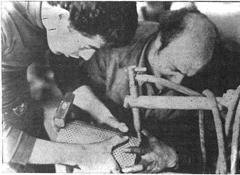
صنعتگران ملی با عشق و ابتکار به تولید قطعات صنعتی مشغولند

در مورد چگونگی تامین مواد خام مورد احتیاج صنایع نیز پرویز لوسانی بدین نظر نظر می کند: «ما الان بهترین کاری که میتوانیم بکنیم، داد و ستد تجاری با ممالک سوسیالیستی است که متأسفانه به ضیاع بسیار از انقلاب با اینکار مخالفت میکنند. من در جلسات متعددی که در وزارت صنایع در بخش صنایع کوچک داشته ام، پیشنهاد کردم که ملت ایران به آسانی میتواند کشورها سوسیالیستی، بویژه اتحاد شوروی، بلغارستان و رومانی هر