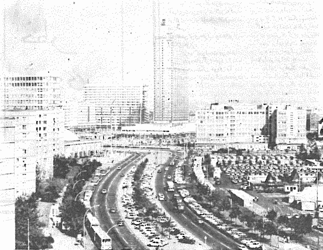
برلین، پایتخت شکوفای جمهوری دموکراتیک آلمان