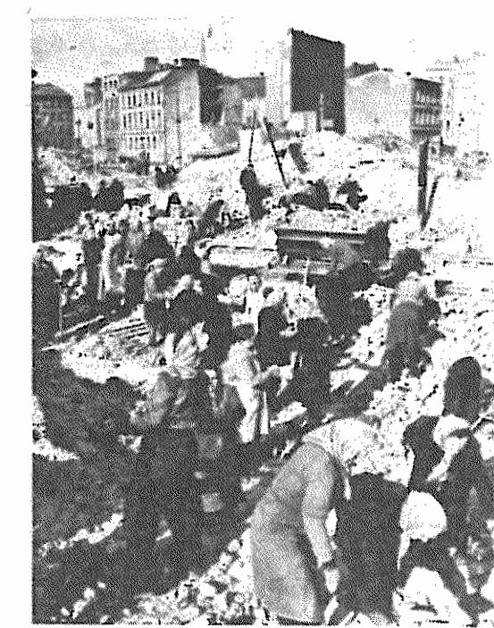
بولین، پس از جنگ دوم جهانی، دهه های ساعت یک به برورانه های جنگ خانمانسوز، جامعه ای نو و شکوفا را پی میریزند.

در گرونیهای بنیادی بودند، اما در آنجا پیروزی انحصارگر توانست در برابر این خواستهای ایستادگی کند. زیرا امپریالیست های اشغالگر غرب، بویژه در شرایط جنگ سرد، به یاری فلالانه آنها شتافتند. باین ترتیب هدف پیدایش یک آلمان واحد دموکراتیک، بر پایه قرارداد پشدم حاصل نشد. به ویژه آنکه، در اوایل سال ۱۳۲۷ مقامات نظامی مناطق غربی آلمان فرمانی مبنی بر اجرای یک فرم پولی صادر کردند، که اعتبار آن به محدوده اشغال آنها منحصر میگشت. این اقدام، که بزودی به بخشی از برلین نیز تعمیم داده شد، عملاً به تقسیم آلمان و نقض قرارداد پشدم انجامید. در پی این گام تجزیه طلبانه و بمنظور حفظ پیروزیهای دموکراتیک و ضدفاشیستی بود، که در ۱۵ سپ ۱۳۲۸ بنیانگذاری جمهوری دموکراتیک آلمان اعلام گشت و دولت شوروی اجازه امور منطقه خود را به ارگانهای آن کشور واگذار کرد.