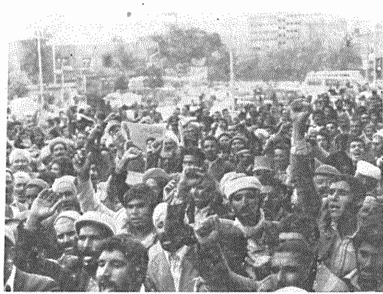
دهقانان چندین روستای استان خراسان برای احقاق حقوق خود، دست به تظاهرات با شکوهی در جلوی دادگستری مشهد زدند

خواست اسامی آنان زمین، آب، بذر و تراکتور است. رفع کمبود زمین و وسائل تولید در این روستا و رسیدگی به خواست دهقانان ضروری است. با توجه به اینکه بخش مهم جمعیت روستایی را در این ده دهقانان خردمندان تشکیل میدهند، عدم رسیدگی به خواستهای آنان، بی تفاوتی و بی اعتنائی به اکثریت جمعیت زحمتکش