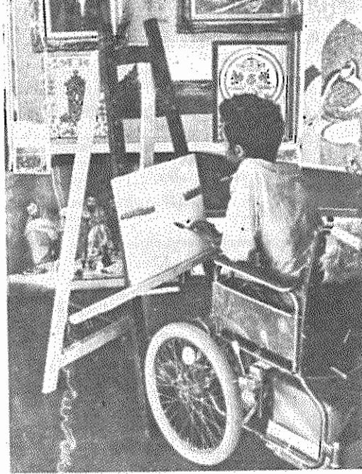
یکی از معلولین در حال کشیدن یک تابلو

یک کارگرمعلول: مسئولین مملکتی معلولین را سرمی‌دوانند