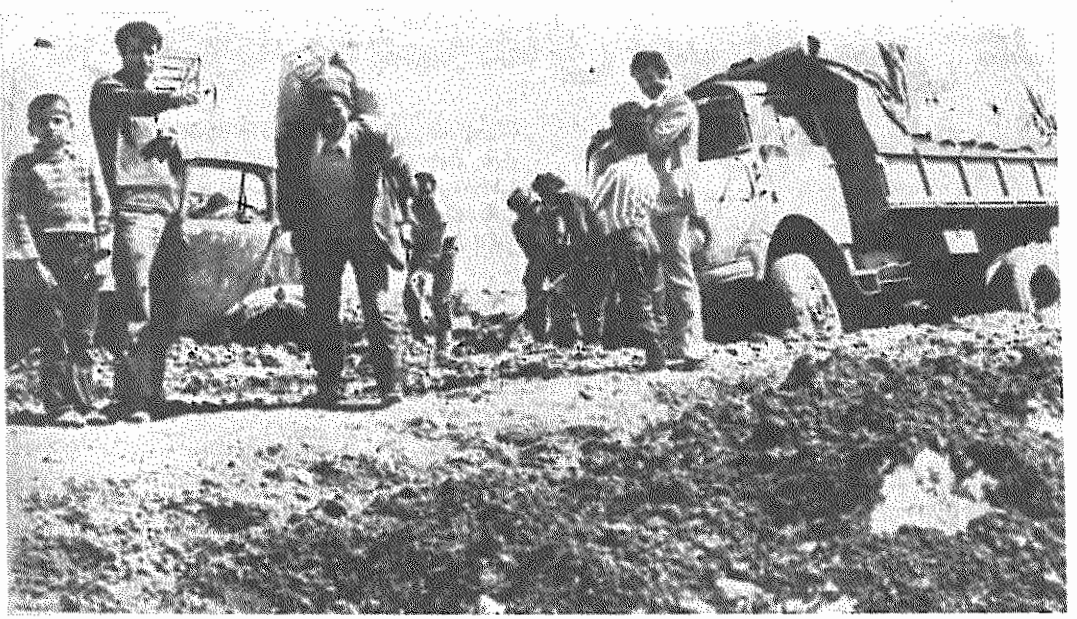
جاده های روستایی - اگر چنین چیزی وجود داشته باشد، اغلب خرابند و وسایل نقلیه به گل می نشینند. احداث و تعمیر راههای فرعی روستایی اهمیت فراوان دارد

روستای چالی چندماه قبل جهت تامین آب آشامیدنی لوله کشی شده، ولی از وجود آب خبری نیست. مردم این روستا نسبت به جمعیتی که دارد، بخاطر استفاده از آب تهر مزبور بیش از هر جای دیگر بیمار میشوند و کسی نیست که به تقاضای مکرر آنان توجه نماید. مستدعی است بخاطر حفظ سلامتی مردم این روستا وسرایت بیماریهای واگیر و غیره به نقل اطراف، هرچه