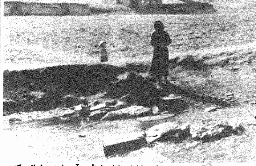
دهسپاهل (نزدیک مهاباد) - تنها محل تامین آب مشروب اهالی، که در موقع طغیان رودخانه بزیر آب می رود و غیر قابل استفاده میشود

برای این منظور پیش از همه مواظب خرمنا باشید، تا اعمال ضد انقلاب، این نوکران حلقه بگوش امپریالیسم آمریکا و مالکان بزرگ، نتوانند محصول را در این شرایط انقلابی از چنگ شما بیرون آورند. برای این منظور همچنین مواظب تحریکات و خرابکاری های عمال بزرگ مالکان باشید. آنها در این لحظات ممکن است، دست به تخریب بزنند و چماق داران خود را به ده بفرستند. ولی شما اگر متحد باشید و به نیروهای انقلابی سپاه پاسداران و جهاد سازندگی تکیه کنید، از بیابان غارتگر هیچ غلطي نمی تواند بکنند. آنها کوچکتر از آنند که بتوانند در برابر تصمیم انقلابی و اراده شما بایستند. حق با شماست و شما پیروز خواهید شد. آماده باشید! بمسئولان دولتی و نهاد های انقلابی برای اجرای هر چه سریعتر و بهتر و قاطعتر اصلاحات ارضی کمک کنید.