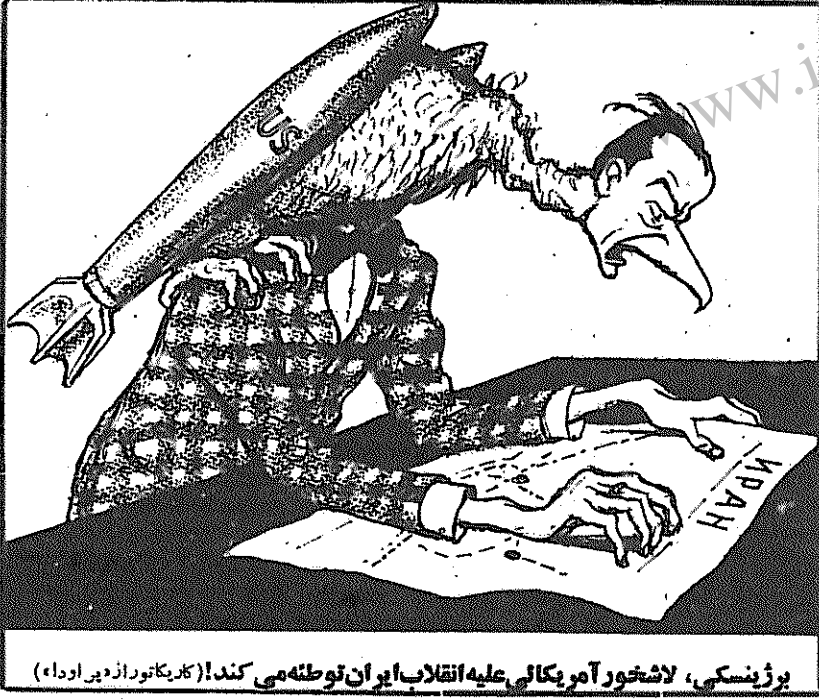
برژنسکی، لاشخور آمریکائی علیه انقلاب ایران توطئه می‌کند! (کلید تورا زدی اورد)

سفینه فضایی سایوز ۲۴، به سر نشینی بر تالان فارکش و والری کوپالسوف فضانوردان مجارستان و اتحاد شوروی به آزمایشگاه فضایی سایوت ۶ پیوست و این دو فضانورد وارد سفینه سایوت ۶ شدند و وارد استقبال پاهوفو روین، سر نشین آن قرار گرفتند. این ۴ فضانورد اکنون آزمایشهای مهم علمی انجام می‌دهند. لئونید برژنف و یانوش کلاو، رهبران اتحاد شوروی و مجارستان، تلگرافهای تبریکی به ۴ فضانورد سایوت ۶ مخابره و برای این فضانوردان در انجام پژوهشهای علمی آرزوی موفقیت کردند. رهبران اتحاد شوروی و مجارستان تأکید کردند که این تجربیات علمی برای آینده بشریت اهمیت اساسی دارد. ۴ فضانورد سایوت ۶ در پاسخ به این تلگرافها یاد آور شدند که حداکثر تلاش خود را برای موفقیت در انجام وظایف محوله انجام خواهند داد.