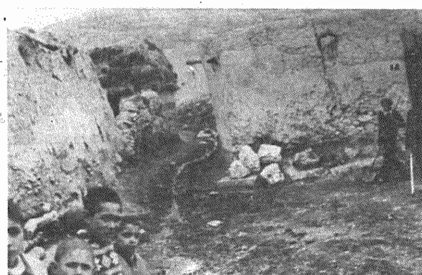
روستای حکیم قشلاقی - این دیوار های شکسته را فرو ریزیم و خانه های در شان انسان بسازیم.

باشین برخواست محصول خریداری شده و دولت سرگرم تلاش برای بهبود وضع گله داری در کشور است و بدین منظور یکبزاروشمشد گاوین بمنظور اصلاح نژاد گاوهای این کشور از ژاپن و کانادا خریداری شده است. او گفت: «مادرمد هشتیم که میزان تولید و کارایی خود را در این زمینه ۷۰ درصد بالا ببریم» در حال حاضر تیکاراکوته یود شیر به بازار آمریکای مرکزی صادر میکند و در تلاش برای افزایش تولید گوشت گاو خود است.