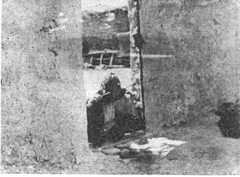
لااقل فرزندش باید روی سعادت و سربلندی را ببیند (روستای حسین آباد - نزدیک شیراز)

بزرگ مالکان فارتگر، مسبب بدبختی دهقانان و عقب ماندگی دهات و پایگاه امپریالیسم جهانیان هستند. انقلاب ایران باید هر چه سریعتر و قاطع تر بساط بزرگ مالکی را برچیند