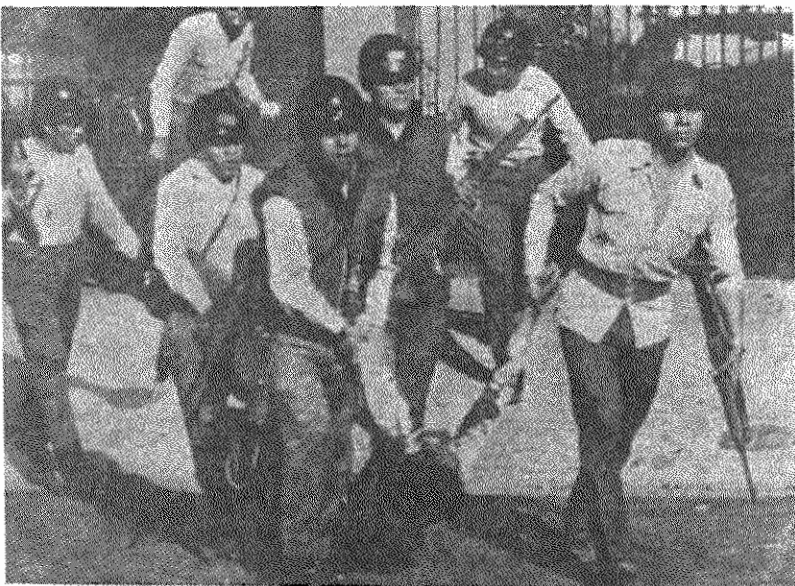
سربازان مزدور رژیم دست نشانده السالو ادور با مبارزان خلق رقتاری وحشیانه دارند.

شقیق خورگه هندل، دبیر کل حزب کمونیست السالو ادور، چندی پیش در مصاحبه ای با خبرگزاری «پرنسالتینا» درباره استراتژی و تاکتیک حزب خود در قبال وضع بحرانی السالو ادور و هدف های فوری و دراز مدت کمونیست های السالو ادور مطالب مهمی بیان داشت، که ما در زیر بخش های عمده آنرا از نظر خوانندگان می گذرانیم: