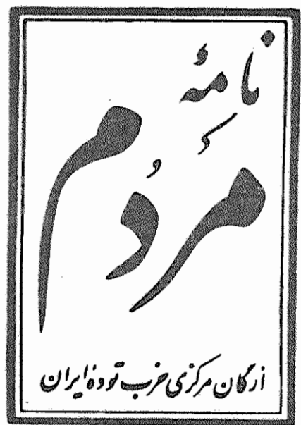
دوره هفتم، سال دوم، شماره ۲۵۷ شنبه ۲۴ خرداد ۱۳۵۹ - شماره ۱۵۵۵

شبکهای تحت نام «براندازی در پیرانشهر» تشکیل داده و برای سرنگونی جمهوری اسلامی ایران فعالیت میکردند. حجت الاسلام دی شهری، حاکم شرع دادگاه انقلاب ارتش، در مورد کشف این شبکه به خبرنگار کیان اظهار داشتند: «است که ضد انقلابیون، به سراف سایر فرارهای ارتش، شبکه ای برای توپنه علیه انقلاب تشکیل داده و با برخی از رهبران و مسئولان حزب دمکرات چون قاسملو، سرگرد عباسی، سرهنگ قادری و سرهنگ اسمعیل البیاری، برای انجام توپنه های خویشت در شبکهای تحت نام «براندازی در پیرانشهر» تشکیل داده و برای سرنگونی جمهوری اسلامی ایران فعالیت میکردند. کشف این شبکه ضد انقلابی در ارتش، با رویکرد صحیح همدار-های مکرر حزب توده ایران را در مورد فعالیت نیروهای ضد انقلابی در ارتش، بمنظور گسترش آتش جنگ برادرکنش در کردستان و نیل به سرنگونی جمهوری اسلامی ایران اثبات میکند. ما بارها اعلام کرده ایم که عمل امپریالیسم آمریکا و رژیم بعثی عراق علاوه بر فعالیت مخرب در میان نیروهای