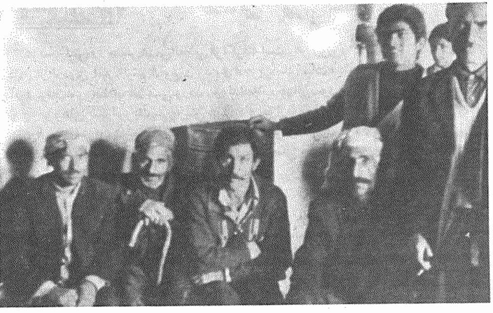
اهالی ده علی اکبر در نزدیکی کرمانشاه برای مشاوره جمع شده‌اند

دهقانان به تجربه دریافته‌اند که برای سروسامان دادن به امور تولید کشاورزی و داهاییاری و کارهای عمرانی و بهبود زندگی خود و برای حل مسائل مختلف، از زمین و آب گرفته تا جاده و تاسیسات عمرانی و تعاون، احتیاج به تشکیل دارند، یعنی باید توسط سازمانها و تشکیلاتی نیروی خود را متحد و متمرکز کنند و برای خواستههای خود مبارزه کنند و آنها را عملی سازند.