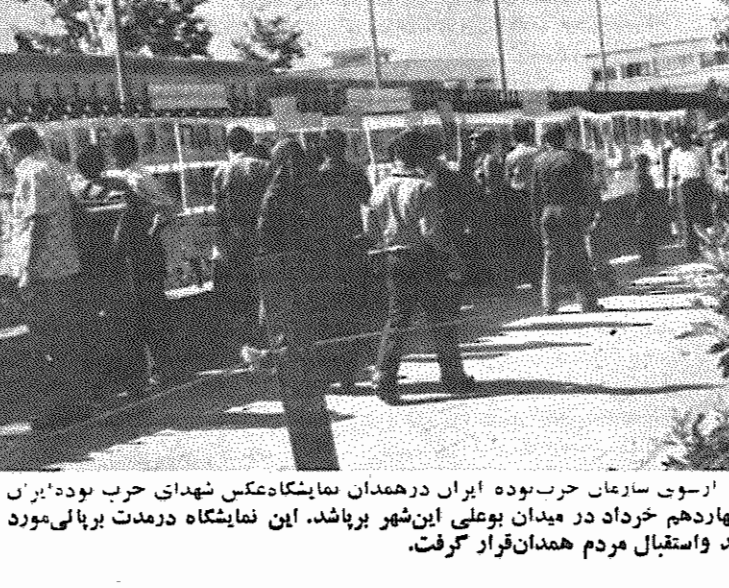
رسوی سازعان حزب توده ایران در همدان نمایشگاه عکس شهدای حزب توده ایران روز چهاردهم خرداد در میدان بوعلی این شهر برپا شد. این نمایشگاه درمات برپایی مورد بازدید و استقبال مردم همدان قرار گرفت.