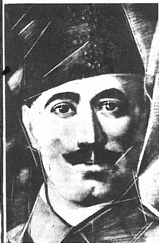
حیدر عموآغلی، رهبر برجسته حزب کمونیست ایران

ممنوعه ۲ بمناسبت شصتمین سال تاسیس حزب کمونیست ایران حزب کمونیست ایران و مسئله ارضی