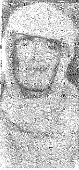
جوانی، در کنار کوره ها بر باد می رود...