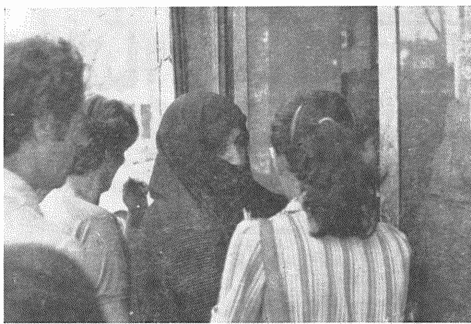
دروصف شیر: لبنیات گران است، حتی پیروز هم نمی‌شود خرید کارگران که در گرما و زیر آفتاب گرمی‌گیم، قیمت ماست نسبت به سال گذشته گرانتر، تفریبی پیدا نکرده است. خوردن آب‌میوه صرف زیادی دارد. در حالی که شده است، ولی حقوق ما کارگران هیچ

بررسی قیمت‌ها در بازار نشان می‌دهد که قیمت پیروز هم نسبت به سال گذشته تا ۲۸ درصد افزایش پیدا کرده است. ماست هم در عرض یکسال گذشته تا ۵۰ درصد افزایش قیمت داشته است. ماست کیلویی (فزاری) که در سال گذشته به قیمت