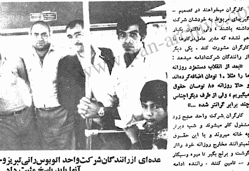
عده ای از رانندگان شرکت واحد اتوبوسرانی تبریز و حومه - به خواستهای بحق آنها باید پاسخ مثبت داد

شرکت امپریالیست ها از پرداخت مزایای کارگران خودداری میکنند! شرکت، «امپریالیست» در صد کیلومتری تهران در دامنه البرز قرار دارد. این شرکت عملیات سدسازی (سد خاکی) لار را بر عهده دارد. خود «امپریالیست» ایتهالی است و از سرمایه گذاری سه شرکت «امپریالیست»، «چیرولا» و «لودی جانی» که در ایتهالا به امور مفاطمه مشغول هستند تشکیل شده است. «تسا» شرکتی است ایرانی، که قبل از انقلاب شریک متعاقب سد بوده است، ولی از آنجایی که این شرکت منوط به «هنر ارفامیل» بود و با فایده های ایرانی زدودند داشت، سهامداران شرکت پس از پیروزی انقلاب متواری شدند. در شرکت «امپریالیست» حدود هزار و سیصد نفر کار می کنند (هزار کارگر و ۱۰۰ کارمند). تقریباً همه کارگران در محیط سد لار سکونت دارند. ماشین آلات شرکت بیشتر آمریکایی و از نوع کاتر پیلاز است. کارگران این شرکت از مزایای قانونی محروم هستند؛ باین جهت چندی پیش ضمن نامه ای