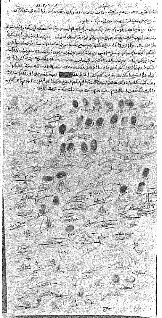
تصویر طومار دهقانان بندرگز