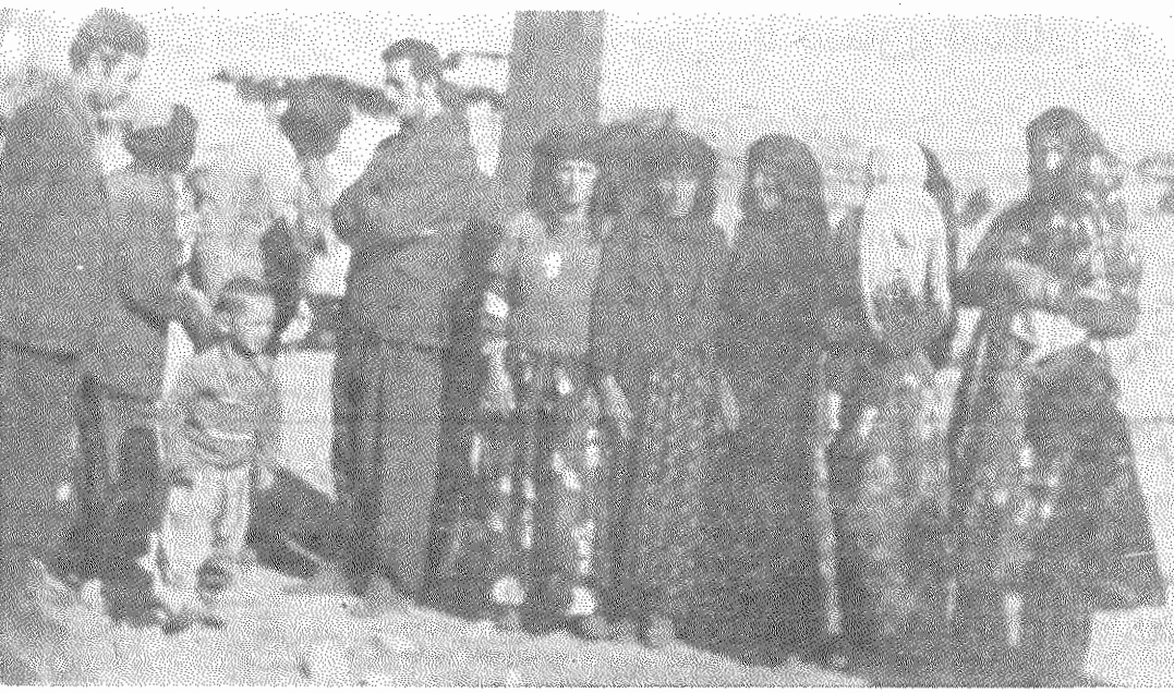
کودکان، زنان و مردان روستای لعل آباد کل کل، نزدیک ماهیدشت - گرومانشاه

«از ۵۶ میلیون تن احتیاجات گندم کشور، هرسال جاری ۶ میلیون