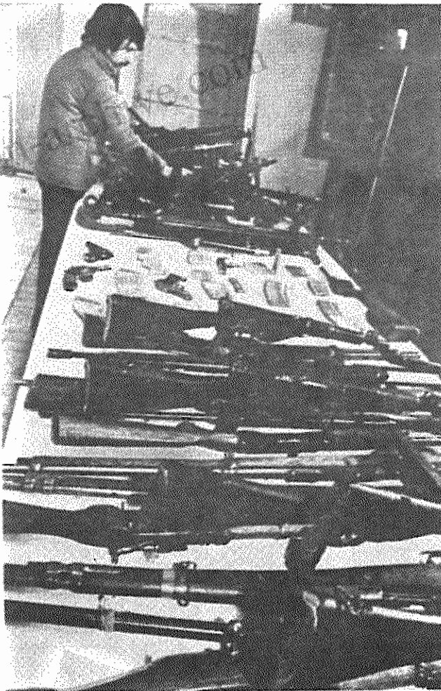
اسلحه آمریکایی و چینی که برای ضد انقلابیون فرستاده میشود

«تاس» ۱۹ ژانویه ۱۹۸۰: «طبق اظهار علی، وزیر جنگ مصر این کشور برای پذیرش «داوطلبان» افغانی آماده است. هم اکنون برای این منظور اردوگاههایی در خاک مصر تشکیل شده، که پیچه در صفحه ۷