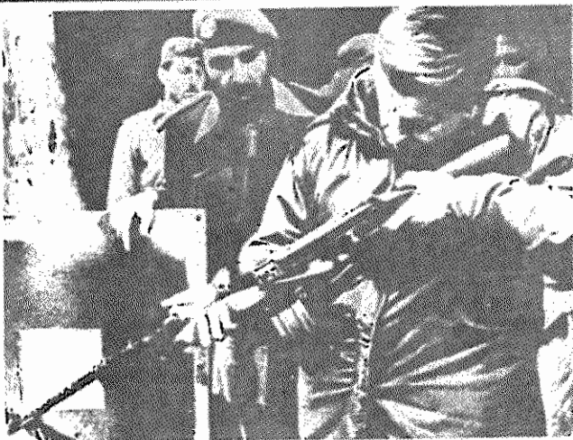
برزیسکی، مشاور امنیت ملی رئیس جمهوری آمریکا، هنگام بازدید از مرز پاکستان و افغانستان، یک اسلحه چینی را آزمایش می کند

روزنامه «اربعه العشر اکبر» چاپ جمپوری دمکراتیک خلق یمن در ۹ ژانویه ۱۹۸۰ نوشت: «در خاک چین و در اردوگاههای ویژه ای در پاکستان هزاران خرابکار تحت رهبری مستشاران چینی تعلیم می بینند و سپس به افغانستان اعزام میشوند. یکن به دشمنان خلق افغانستان کمک مالی میکند و برای آنها اسلحه و مهمات ارسال میدارد. دستهای ضدانقلابی هوازار چین در خاک افغانستان به اعمال خرابکارانه دست میزنند. چین از نواحی مرزی و از طریق بزرگراه قره قوروم، که در پاکستان احداث شده، مقادیر هنگفتی اسلحه و مهمات ارسال می دهد. چین تاکنون معادل چندین میلیون دلار تجهیزات نظامی برای پاکستان فرستاده که قسمت اعظم آن برای مسلح کردن شورشیان افغانی بوده است.»