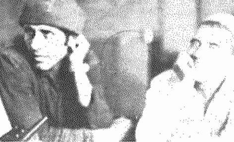
ما وظایف انقلابی خودمان را می دانیم ... اما دولت چی...؟

بخاطر انقلاب در چنین شرایط وحشتناکی کار می کنیم.