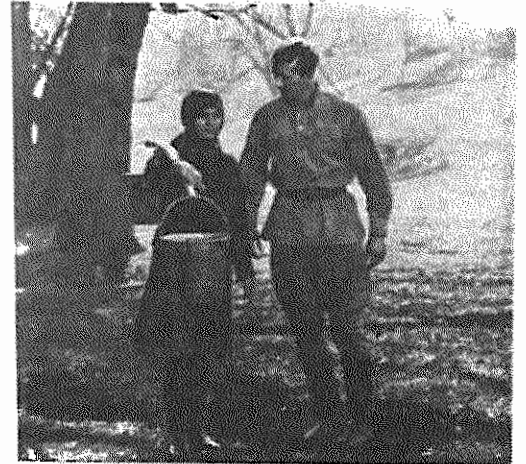
تصویری از فیلم «روزهای سپتامبر» (محصول ۱۹۷۶)