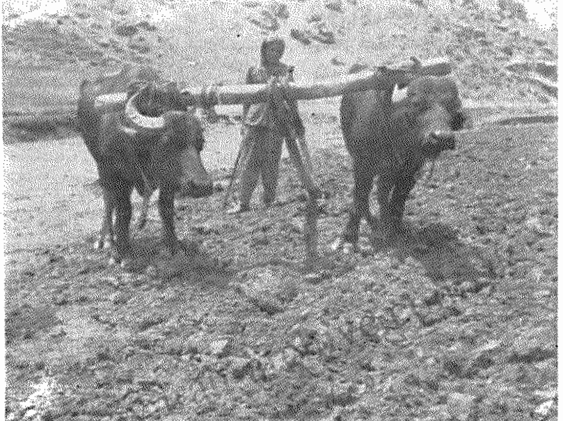
نحوه تولید در قرلجه علیا انسان را بیاد قرون وسطی می‌اندازد

روستای قرلجه علیا، پلازمندگی است از دوران فقر و عقب ماندگی ناشی از تسلط جبارانه طاقتوران. دست‌های زخم بسته و چین روستائیان و چروک‌های عمیق بر پیشانی دهقانان پیر، همه حکایت از وضع فلاکت‌باری دارد که از ریشه شوم تمدن بزرگ آریامیری است. این روستا در ۴۶ کیلومتری شرق مهاباد قرار دارد. جمعیت این روستا ۲۰۰ نفر است. از کل خانوادها می‌سازد در این روستا ۲۴ خانوار کم‌زمین و ۴ خانوار آن بی‌زمین هستند. فقر و گرسنگی و مصائب زندگی از دیوارهای کاهکی و رنگ کودکان رنجور می‌بارد. در این روستا به علت نبودن مراکز درمانی تا حال چندین جوان و نوجوان جان خود را از دست داده‌اند. در قرلجه علیا آب آشامیدنی یا لوله‌کشی خبری نیست و برای دست یافتن به آب باید مسافت زیادی را طی کرد. این کار در زمستان طاقت‌فرسا است. همچون دیگر روستاهای منطقه، در این روستا نیز برق وجود ندارد و کمبود آب تأثیرات بدی بر روی زمینهای منطقه که اکثراً دیسی هستند می‌گذارد. خواست اصلی دهقانان روستا، تقسیم زمین و بهبود وضع زندگی آنان است که خواستی است بحق و قابل اجراء. مقامات مسئول دولت انقلاب با لیستاده از امکانات موجود باید با رسیدگی به خواست دهقانان چیره کره فقر را از این روستا محو کنند.