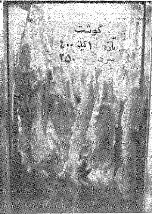
گران به زیان زحمتکشان، ارزان بسود پولدارها...

بر می‌گردیم و سراغ متوسط‌ها می‌رویم. فروشنده یک شرکت تعاونی در خیابان کارگر می‌گوید: «قیمت گوشت گوساله قبل از اجرای طرح تعاونی‌ها از کیلویی ۲۳۰ تا ۲۸۰ ریال و قیمت گوشت کوسفند کیلویی ۳۰۰ ریال بود، حالا آمده‌اند و قیمت گوشت کوسفند را به کیلویی ۴۰۰ ریال رسانده‌اند. تازه قبلاً قیمت ران و سردست کوسفند کیلویی ۳۰۰ ریال بود و حالا قیمت گوشت کوسفند تازه کیلویی ۴۰۰ ریال شده است»