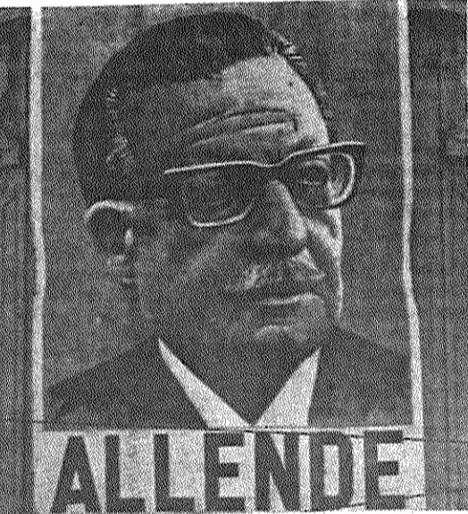
دای ملت شیلی: از شما می خواهیم درسی را که از انقلاب گرفته ایم هرگز فراموش نکنیم (وسیت نامه ساوادور آلنده زیر پیمانان در خیابان آمریکائی)

فیلم «کودتا» هر چند تنها گروه های از توطئه کودتاگران آمریکائی را نشان میدهد، بدلیل شهاب چسب فیلم باوقایع ایران این واقعت عروان داعیان تر می کند. که امپریالیسم آمریکایچه نقشه ای را در سر دارد.