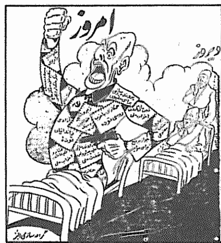
نقل از "شاهد"، ۲۰ اردیبهشت ۱۳۲۲

توجه کلیه مبارزان ضد امپریالیسم، به ویژه مسلمانان صدیق ضد امپریالیسم را به این سلسله مقالات جلب می کنیم