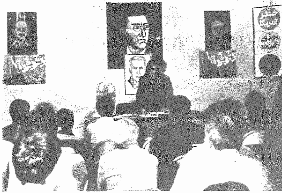
بزرگداشت روز تاریخی ۲۳ تیر در شهرستان مسجد سلیمان