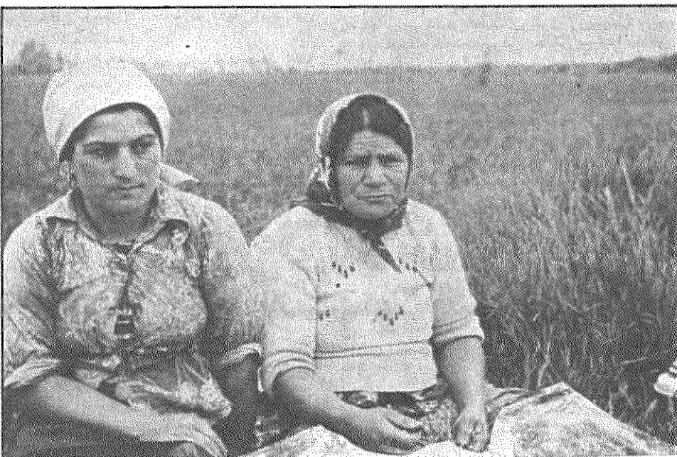
استراحتی کوتاه، بعد از کار طاقت فرسا حتما لازم است و یک پیاله چای، که چاشنی آن باشد، خسته نباشید (زنان روستاهای قائمشهر)

اهالی این منطقه، اگرچه در تقسیم بندی کشوری جزء استان بوشهر منظور شده اند، ولی به دلیل نبودن راه، بیشتر رفت و آمد و ارتباط مردم منطقه در گذشته از طریق کازرون صورت می گرفت. اخیراً با آماده شدن راهی که از ۵ سال پیش مقدمات آن فراهم شده بود و اینک با کمک جهاد سازندگی منطقه و اداره راه، کارهای آن خیلی با سرعت انجام یسافته، مردم منطقه ارتباط بیشتری با شهرهای مختلف استان بوشهر یافته اند. اهالی محل از انواع بیماری ها و نارسائیها، که میراث شوم گذشته است، رنج می برند. راه ندارند، بهداشت مناسب ندارند، تغذیه و بهداشت غیر طبیعی است و مردم ده با این آرزو و امید زندگی و کاروکوش می کنند که، انقلاب تسماه آرزوهایشان را برآورده سازد. در حال حاضر یکی از مشکلات عمده اهالی، شیوع یافتن تب مالت در میان انسانها و دامهای منطقه است، که بعضی از اهالی نخستین نشانیهای آنرا در ۱۷ لی سال پیش می دانند. این امر زندگی طبیعی و کاروکوش روزمره را فلج کرده و در ارتباط با دامها نیز موجب فلج اقتصادی گردیده است. در حال حاضر اقداماتی برای مبارزه با این بیماری شروع شده، که امید می رود هرچه سریعتر پیگیری شود و مردم بتوانند با با یافتن سلامت خود، با تمام توان در خدمت انقلاب قرار گیرند.