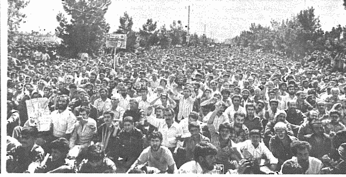
بقیه در صفحه ۸

«سلسله جنابان فاجعه های پی در پی و خونین یعنی پنجاه مظلوم کتف و انسان برانداز آمریکا همچنان آماده است تا حلقوم این ملت را باز هم بشمارد. آنروز آمریکا، اسرائیل، مزدوران خارجی، پیشوایان کفر، فاجعه کربلای ۱۷ شهریور را بوجود آوردند و امروز هم آنها در آنسوی مرزها زنده اند، امروز هم ما هدف و آماج گلوله های هستیم که آمریکائی غارتگر جنایتکار و اسرائیل و مزدورانش به سوی ما نشانه رفته اند. در دومین سالروز جمعه خونین ۱۷ شهریور، توده های میلیونی بر مزار شهیدای گلگون کفن آرزوی پیمان بستند که نبرد با قاتلان آن شهید، یعنی امپریالیسم خونخوار آمریکا بقیه در صفحه ۸