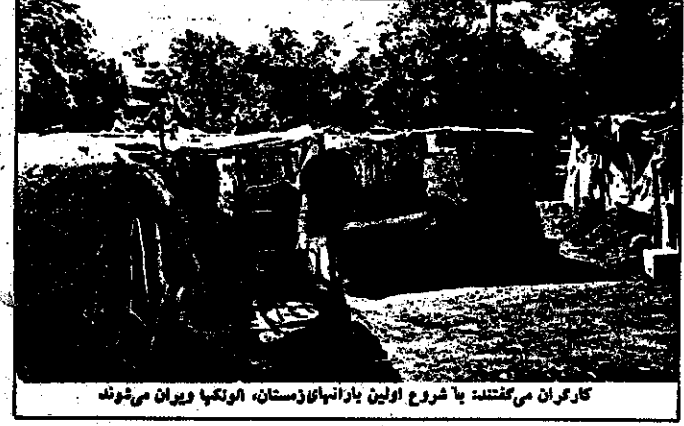
کارگران می گفتند: با شروع اولین یازدهای کوستان، آلوتک ویران می شوند