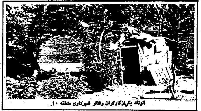
آلوتک یکی از کارگران رفتن شهرداری منطقه ۱۰

برادریم: ترک نگردد، بلرغ، با ریس، چه لوفی با هم داریم؟ ما همه برای شستیم ششیدی حسن میگویی: «چمال دارم، ولی قامت خمیده و چهره پرچینش باورا و عیال نه نشان میدهد، او ادا میدهد: «من اهل کامیاران هستم. آنجا بر- اثر جنگ هیچ چیز پیدا نمی شود، نه درخت، نه جای، نه برنج... هیچ چیز، همه کارها هم خوابیده است. درختچه من هم مجبورم قدم که سه ماه پیش برای پیدا کردن یک لقمه نان، زبونم را با آب و سرکه کسب و الان هم اینجا هستم و در شهرداری کار میکنم. وی درباره شرایط کار و محل سکونت میگویی: