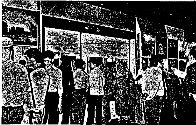
گوشه‌ای از غرقه مسلمانان اتحاد شوروی در نمایشگاه تهران

مسئول غرقه مسلمانان شوروی خواهان ایجاد صلح و امنیت در تاجیکستان، از جمله در افغانستان هستند. مسلمانان شوروی معتقدند که خود لبروهای شوروی در جمهوری دموکراتیک افغانستان بخاطر ایجاد صلح و امنیت کشور افغانستان است. ما هیچ متفکر تاجیک که سرانجام ما در خاک هسایه یک ما افغانستان باشد ولی خود سرانجام شوروی به خاطر تجزیه‌ای است که از خارج برای ایجاد کردن جمهوری دموکراتیک افغانستان صورت می‌گیرد.