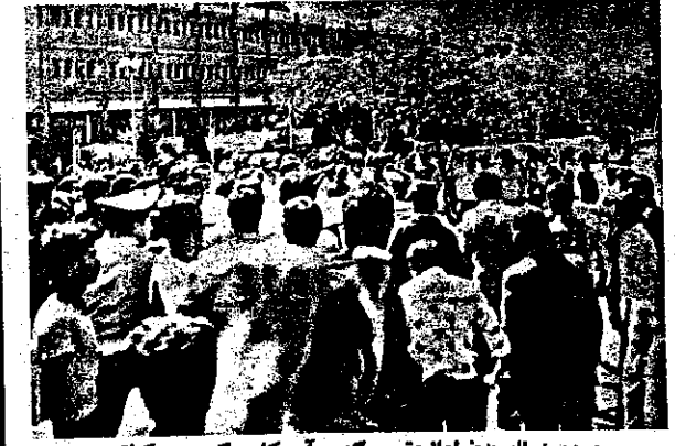
مردم خطاب به ضیاء الحق: هرگ برژینسکی، هرگ برژینسکی

مردم مبارز تهران، ضیاء الحق را از نمایشگاه بین المللی بیرون کردند! حاضرین در نمایشگاه با مشاهده ضیاء الحق فریاد زدند: هرگ برژینسکی، هرگ برژینسکی!