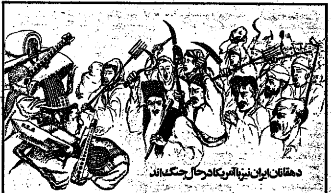
دهقانان ایران نیز با فقر و محرومیت دستگیرند