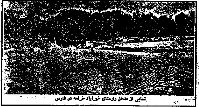
نمایی از محل روستای غیرآباد خرامه در فارس