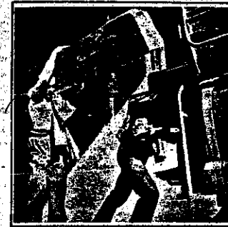
روزی دست نشانده بهلقی پس از سقوط غویش، ارضیهای شومسایری برای یافتن مستندیهها با بهجا گذاشت که بیکر از آن ها "مهاجرت روستایی است".

کارگران این کارگاهها در شرایط بسیار دشواری کار میکنند. حقوق آنها بسیار کم است و ساعات کاری آنها بسیار طولانی است. کارگران این کارگاهها در شرایط بسیار دشواری کار میکنند. حقوق آنها بسیار کم است و ساعات کاری آنها بسیار طولانی است.