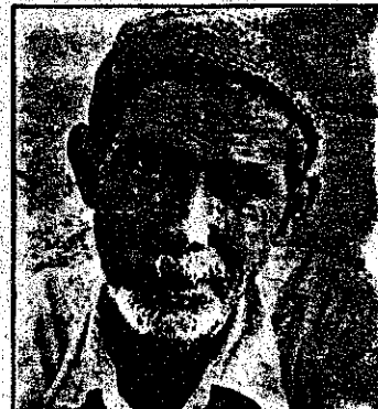
یکی از خوش‌نشینان روستای عباسی آباد پس از سالها ظلم و ستم بزرگسالان اینک بصیرانه در انقلاب کار هیئت مفت تئری است.

روستای عباسی آباد در شهرستان مریخی آباد و در استان آذربایجان شرقی واقع است. این روستا در حدود ۲۰۰ خانوار جمعیت دارد. روستاییان این منطقه همواره در معرض ظلم و ستم بوده‌اند. در این روستا، زمین‌ها در اختیار اشراف و اعیان قرار دارد و روستاییان مجبورند به عنوان اجیران و کارگران در زمین‌های خود کار کنند. این وضعیت باعث شده است که روستاییان هیچ‌گونه آزادی و حقوقی نداشته باشند.