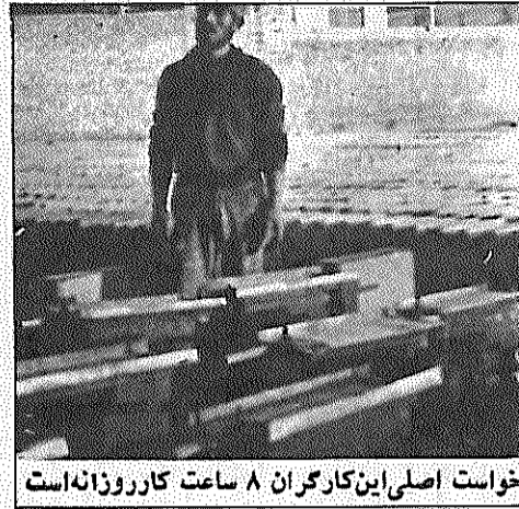
خواست اصلی این کارگران ۸ ساعت کار روزانه است

جندی پیش برای آگاهی اوضاع کاروندگی کارگران "بلوک زن" الیگودرز به میان آنها رفتیم و با آنها به گفتگو نشستیم. نخست پیرمردی که ساکت در کنار ما ایستاده بود، اینطور آغاز سخن کرد: