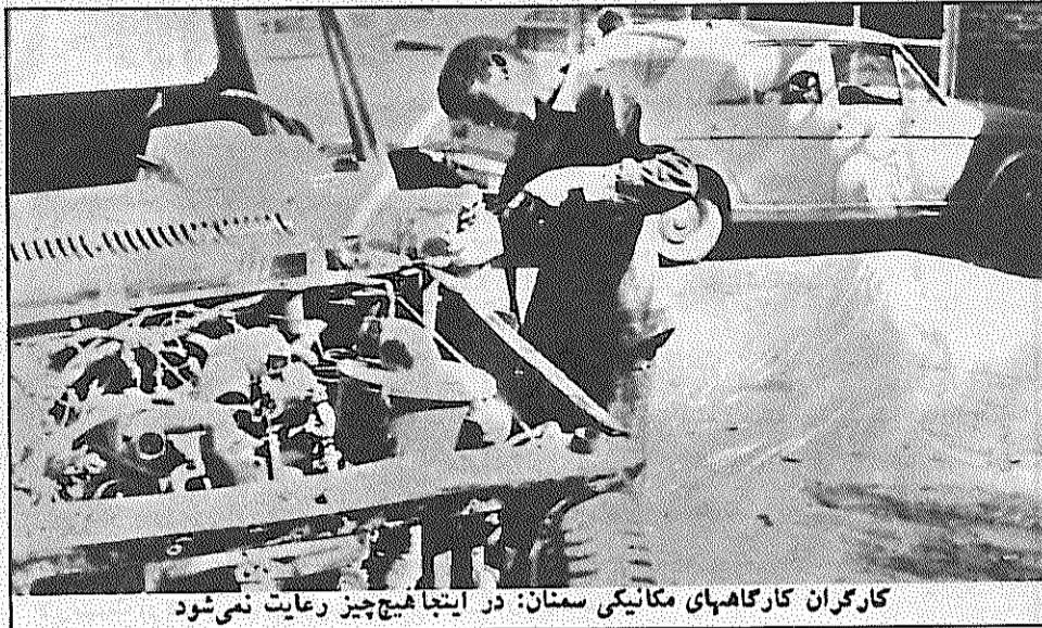
کارگران کارگاههای مکانیکی سمنان: در اینجا هیچ رعایت نمی‌شود

شدم . او اهل گرمسار بود و گفت : " من نتوانستم درس بخوانم ، چون وضع مالی خانواده‌ام خیلی خراب بود . از گرمسار که سمنان آمدم در یکی از تعمیرگاهها شروع به کار کردم . ابتدا به من مزدی نمی‌دادند ، اگر حادثه‌ای برای شما رخ دهد ، مهارت کافی نداشتیم ." او اضافه کرد که : " از ساعت هفت و نیم صبح الی ده شب کار می‌کنم و فقط روزی پانزده تومان مزد می‌گیرم ، آنهم به این علت است که می‌توانم ماشین تعمیر کنم ." از او پرسیدیم : اگر حادثه‌ای برای شما رخ دهد ، چه کسی شما را تامین می‌کند ؟ گفت : " نمی‌دانم . در اینجا هیچ چیز نداریم ، حتی بهداشت . من وقتی کارم تمام می‌شود ، پس از شستن دستهایم با پول خودم به حمام می‌روم ." در کارگاه دیگری با یکی از کارگران به گفتگو شستم . او گفت : " هر روز صبح زود تا ساعت ده شب کار می‌کنم حتی روزهای جمعه . صاحب کارگاه با شنیدن کوچک‌ترین صدای اعتراضی ، کارگر معترض را فوراً اخراج می‌کند ." این است وضع کارگران کارگاههای تعمیرات وسایل در سمنان . آنها از حداقل مرا می‌بهرند ، آنها به خاطر آنکه نگر سود ، در مقابل احفای صاحب کارگاهها مجبور به سکوت هستند . مسئول اداره کار سمنان ساد هر چه رود تره وضع کارگران این کوه کارگاهها رسیدگی کند تا هر چه سسر زحمتکاران را به انقلاب اسدوار یارد .