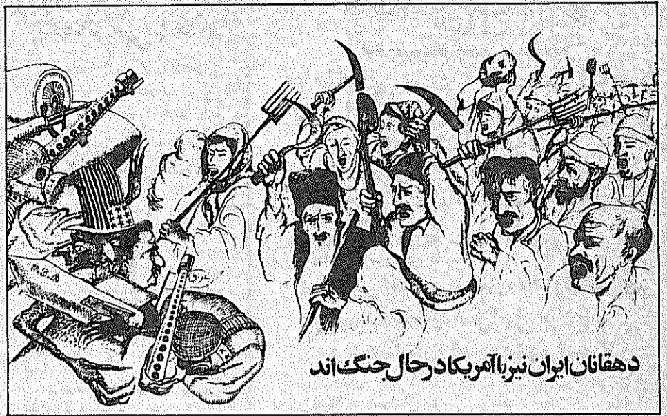
دهقانان ایران نیز با آمریکا در حال جنگ اند