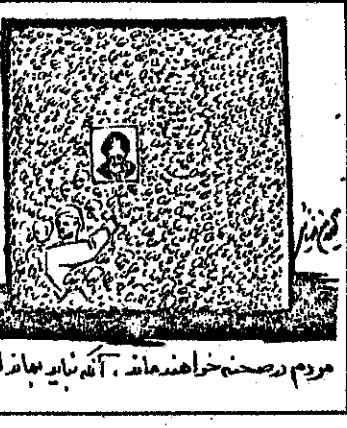
مردم رصحنه خواهند ماند، آنکه بایر بمانند امیرالیم امروا است