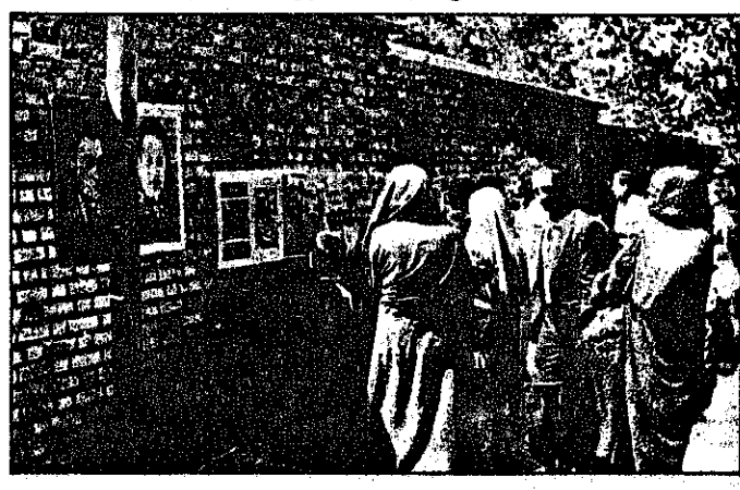
شهیدای حزب توده توده ایران چه نمایش گذاشته شد. نمایشگاه مورد استقبال مردم قرار گرفت.

حمله تهاجمی کاروانه رژیم جنایتکار صدام حسین که به دستور امپریالیسم آمریکا صورت گرفت است، با دفاع سرخشان مردم قهرمان دلاور ایران روبرو شده است. موج از جان گذشته و اتحاد مردم ایران، هدف های رژیم تجاوزگر صدام حسین را با ناکامی روبرو ساخته است.