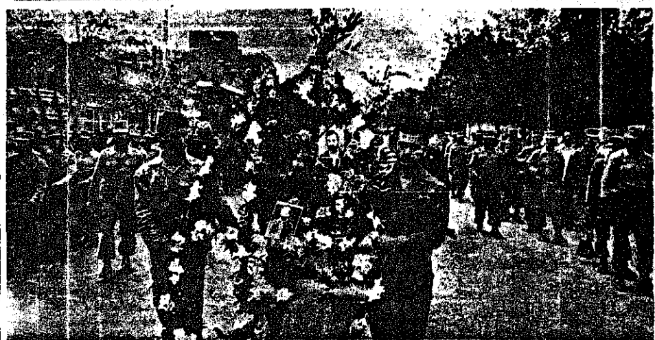
مراسم تشییع جنازه رفیق شهید عسکر دانش شریعت پناهی در سمنان

روحانیت مبارز، سپاه پاسداران، گارد احترام شهزادانی، دسته موزیک ژاندارمری، اعضای هیئت سیاسی کمیته مرکزی حزب توده ایران در مراسم تشییع جنازه رسمی رفیق شهید شرکت داشتند. شهر سمنان برای تشییع جنازه شهید شهر، یکپارچه تعطیل شد. جنازه رفیق شهید در صحن امامزاده یحیی در کنار سزار سرپاژ گنجانده شده بود. مادر رفیق شهید، آنها را کمی گریستند. تسلی می داد و می گفت: «بر شهادت او گریه نکنید. او به آنجا رفت که دلش میخواست. او براه وطنش، براه حزبش رفت. استوار باشید. راهش را ادامه دهید.»