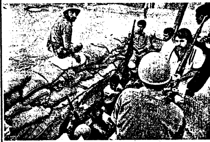
یک سنگر خیابانی - جوانان، پاسداران، سربازان، چون تن واحد آماده رزم و شهادت در راه انقلاب و جمهوری اسلامی ایرانند.

* هواپیماها و توپخانه رژیم جنایتکار صدام حسین محلات و حمتکش تشین را مورد حمله قرار داده اند. * جوانی در سنگر گفت: امریکای کثیف بدانند که ما تا آخرین قطره خونمان در سنگر خواهیم ماند. * یک پسر بیچ ۱۲ ساله تفنگ بدست، تا صبح پاسداری داد و مدام شعار میداد: مرگ بر آمریکا! * زحمتکشان اهواز: ما خانه ما را خالی نمی کنیم. می مانیم و می جنگیم تا پیروز شویم. صحنه ۲