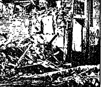
تجاوزگران صدامی خانه های زحمتکشان را هدف گرفته اند.