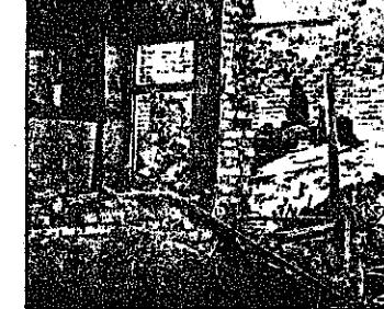
تجاوزگران صدامی خانه های زحمتکشان را هدف گرفته اند.