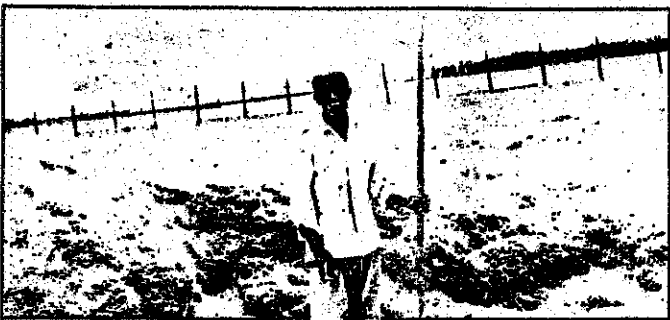
مالکان روستای شمس آباد دور زمینها را کرده کشی کرده اند، تا از اجرای عدالت « مصون » بمانند با اجرای قانون، حق را به حق دار برسانید و زنده های ظلم و استعمار را برچینید

۷ تن از خوش نشینان این روستا، بعد از ضروری انقلاب، به هدفیات کوشیده اند تا بمقدار زمینهای مالکان را در اختیار گرفته و روی آنها کشت کنند. ولی تاکنون برای قدرت نمایی مالکان و چاق کردن آنها نتوانستند موفق به محاصره زمینها شوند. خوش نشینان، با انتصاب یک شورای سفیره ( کمیته آزانان زده هفتان کم زمین